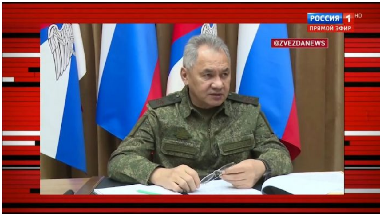
Ministr obrany Sergej Šojgu

dostane do rukou ukronacistů, jak vojáky ukrajinské armád nazývá v pořadu Vladimir Solovjov. Nedivte se obyčejným Rusům, že začínají mluvit o zradě. Tohle opravdu smrdí, k čemu došlo.