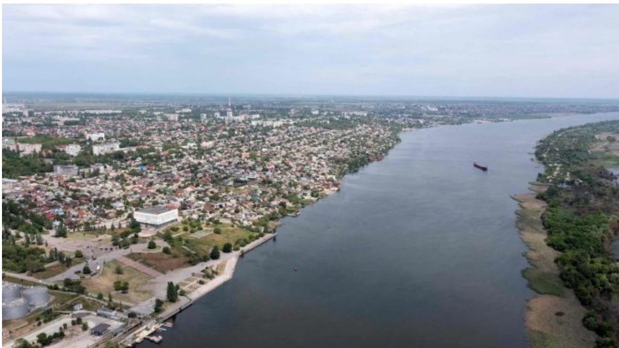
Vlevo město Cherson, vpravo levý břeh Dněpru

NATO zablokovalo Ukrajincům navigační palebné systémy, které přestaly fungovat, přestalo pracovat zaměřování raketometů HIMARS a americké výzvědné drony Global Hawk přestaly Ukrajincům předávat palebné souřadnice. A to není všechno. Volodymyr Zelenský ve čtvrtek oznámil, že Ukrajina je připravena k jednání, ale ze seznamu podmínek zmizela zmínka o tom, že Kyjev bude jednat pouze s nástupcem Vladimira Putina, nikoliv s ním.