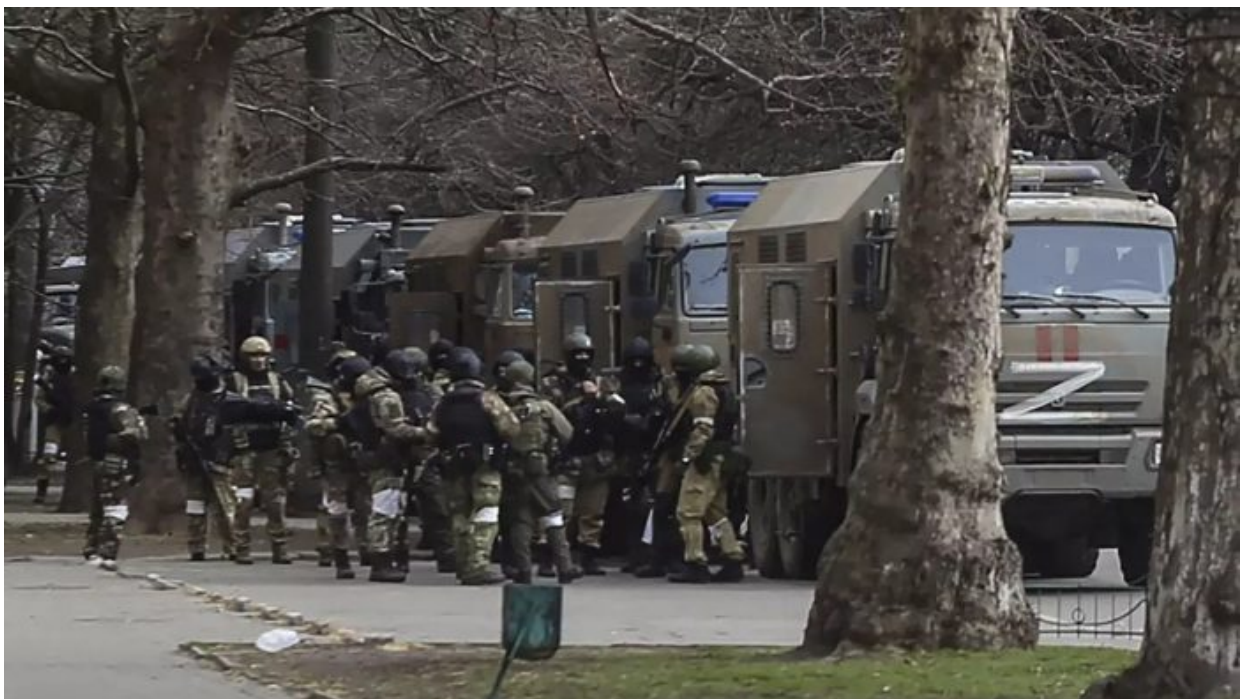
Odjezd ruských vojáků z Chersonu

Rozkaz byl vydán ministrem obrany na návrh velitele speciální vojenské operace a generála Sergeje Surovikina, který stažení zdůvodnil problematickým zásobováním vojenských útvarů na pravém břehu Dněpru, které závisí na pár mostech, které jsou pod neustálými útoky ukrajinské armády a kdykoliv, v případě přesného zásahu a zničení mostu, může dojít k odříznutí ruských vojsk na pravém břehu Dněpru. Z vojenského hlediska to zní logicky. Ale z politického hlediska jde o katastrofu.