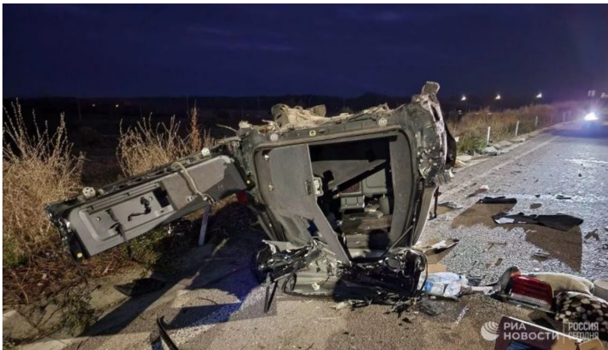
Odtržená skořepina Stremousovova auta

kdy pancéřovaná kabina byla jako skořepina odtržena od podvozku auta po údajné srážce s kamionem. Tomuto příběhu ruských úřadů ale prakticky nikdo na ruských sociálních sítích nevěří, protože při srážce obrněného auta s kamionem nedojde k odtržení obrněné skořepiny od podvozku, protože to je nesmysl z fyzikálního hlediska.