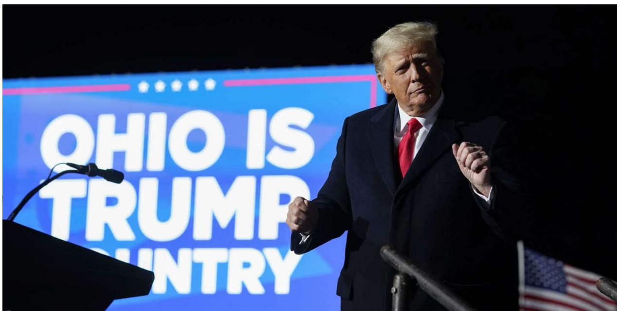
Donald Trump si na mítinku v Ohiu zatancoval

Donald Trump nechce na nic čekat, protože se očekává, že výsledky voleb do Kongresu budou zřejmě zpochybněny a doprovázeny řadou podvodů a manipulací se sčítáním, takže čekat až někdy do prosince, než budou sečteny korespondenční hlasy, prostě nemá smysl. Stanice ABC uvedla [2], že by se výsledek voleb mohl po sečtení došlých korespondenčních hlasů “překlopit” ve prospěch demokratů jako v roce 2020.