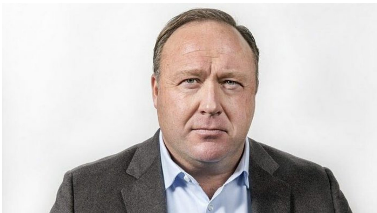
Alex Jones, šéf Infowars

Útočníkem byl 20-letý a ambulantně na psychické problémy léčený Adam Lanza. Za svobodu slova a za svobodný názor byl Alex Jones odsouzen k astronomickému odškodnění pozůstalých za “emocionální újmu“. Ani kdyby zabil a zavraždil desítky lidí, nedostal by k zaplacení takové odškodné jako za svobodu slova. Je to proces likvidace alternativy podle stejného a společnéhoustru, jenom dekorace a formy se odlišují mezi USA a Evropou.