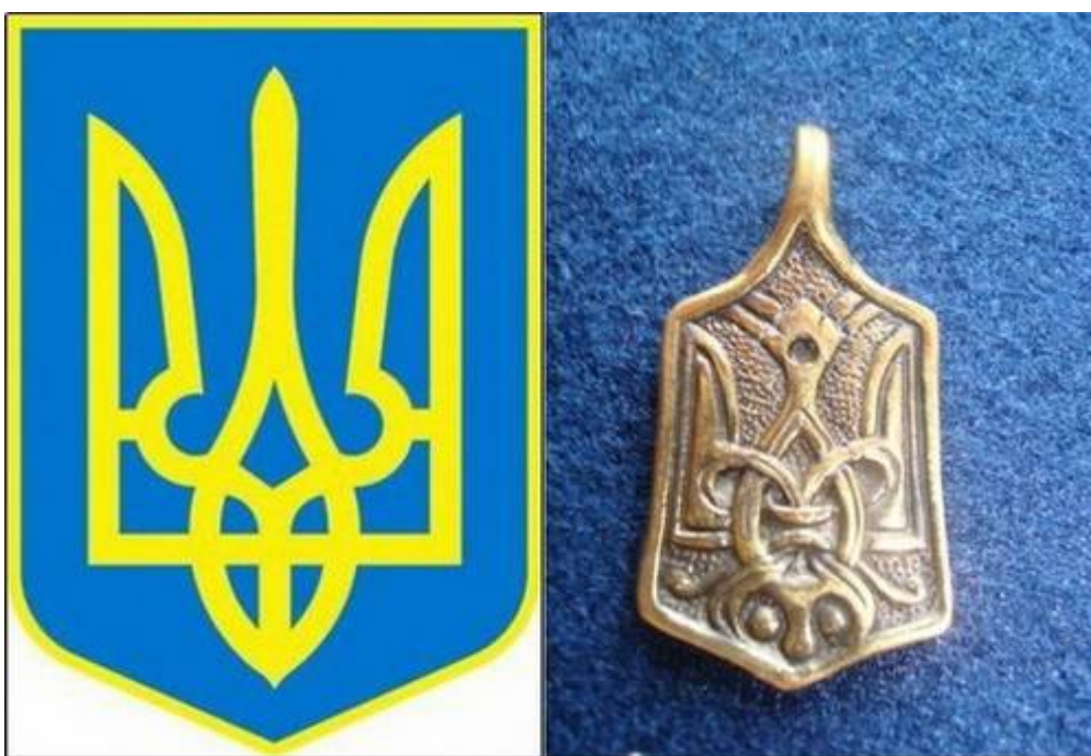
Хазарская тамга и герб Украины

Onoğurové či Oğurové byli turkičtí nomádi na koních, kteří mezi 5. až 7. stoletím kočovali z východu do černomořských a kaspických stepí a oblasti řeky Volhy na odvěké území Slovanů a íránského národa Skythů. Skythové byli rovněž válečníci na koních, ale neznali třmeny. Turkité měli od Číňanů třmeny a kompozitní luky a mohli tak efektivně střilet za jízdy na koni. Skythové se stáhli na severní Kavkaz a tvoří polovinu dnešních Čečenců. Turkité Slovany zotročili. Slované jim museli platit daně. Turkité lovili Slovany, na krk jim vypalovali cejch Tamga (Tamga je dnešní ukrajinský státní znak Trojzubec) a prodávali otroky Slovanů do Byzance.