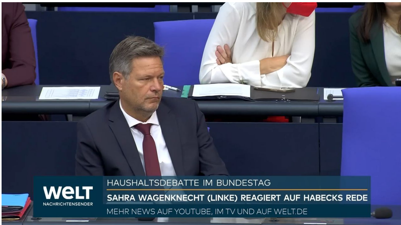
Robert Habeck, ministr hospodářství

Když Německo začne subvencovat ceny energií pro německý průmysl, povede to k tzv. sifonovému jevu na burze. Tento jev spočívá v tom, že čím více se něčeho nakupuje za přemrštěnou cenu, tím více zájemců to přitahuje a cena o to rychleji roste. Dochází tak k tomu, že k plynu z USA v LNG zásobnících se chce dostat co nejvíce zemí a strhne se na burzách tzv. licitace, tedy dražba a přeplácení protivníků. A na tento styl nákupů těch 200 miliard EUR pro německý průmysl prostě nestačí. Zásobníky v Evropě jsou dnes naplněny z velké části zkapalněným plynem z USA, který byl získán frakováním z břidlicového podloží v USA.