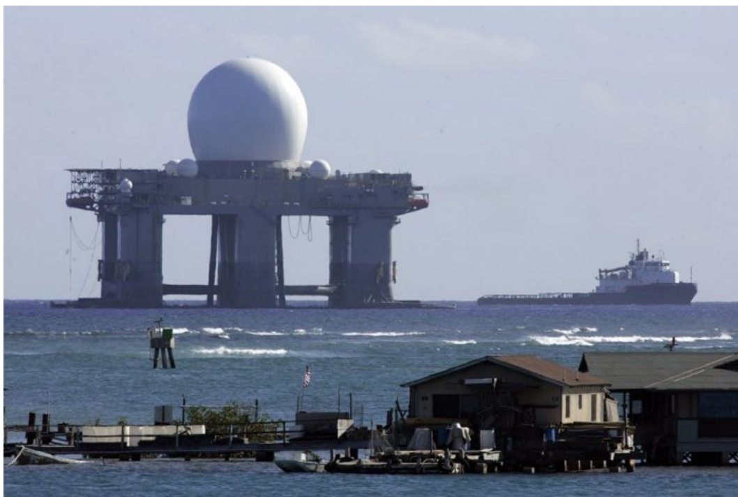
Zahorizontální radar americké armády na plovoucí plošině

Lidé se začali scházet k uctění památky 74-letého muže, kterého podle našich včerejších informací od našeho zdroje dohnala k tomuto činu tíživá situace s dluhy, které vznikly kvůli fakturám za energie. Muži podle dalších informací nezbyvaly peníze dokonce ani na jídlo, zanechal po sobě dopis, který ale byl v úterý oficiálně popřen, že prý žádný dopis nezanechal. Jak se dalo očekávat, na případ je uvaleno informační embargo a nic se nesmí dostat ven.