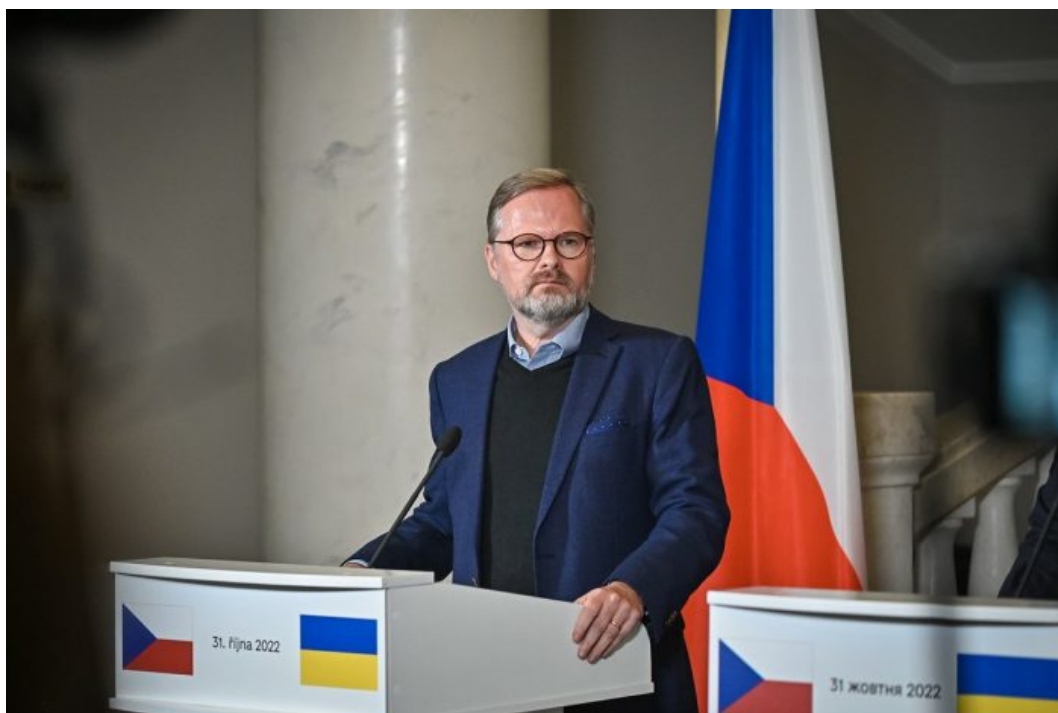
Petr Fiala v Kyjevě nasliboval Zelenskému hory doly

A víte, kdo to dosud platí? Americký státní rozpočet! Jakmile se americká kasička přeorientuje z Ukrajiny do Tichomoří, tak celá Ukrajina spadne do náruče EU jako hořící a žhnoucí válečný balvan, který potřebuje chladit 4 miliardami EUR každý den, jinak Ukrajina zkolabuje a s ní i celá Evropská zahraniční politika. A víte, co v této situaci bude chtít udělat Brusel?