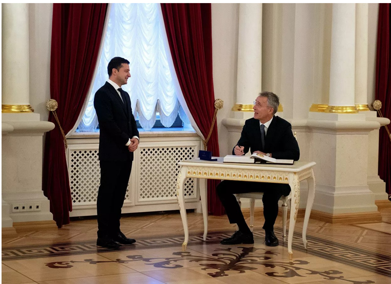
Volodymyr Zelenskyy a Jens Stoltenberg

To bude stát obrovské peníze, a ty mají poskytnout jednotlivé země, ale podle všeho tajně, aby o tom našťvané obyvatelstvo, které je na pokraji zhroutil při pohledech na faktury za plyn a elektřinu, nevědělo, nevzbouřilo se a nevyrazilo do ulic proti vládám, že sypou peníze do zbrojovek a do zbrojení, zatímco lidé mrznou v bytech ve svetrech a svítí jenom svíčkami ze strachu z faktur za elektřinu.