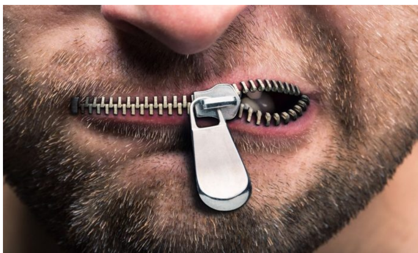
Zavřít novinářům hubu, to je cílem nového zákona

Zákon by měl mít podle informací celkem 6 paragrafů a měl by blokovat takové weby, domácí nebo zahraniční, které publikují nebezpečné informace, které ohrožují bezpečnost České republiky. Takovou informací jsou třeba studie o potenciálních rizicích vakcín. Pokud nějaký server publikuje dokumenty z nějaké americké studie, které zpochybňují deklarovanou bezpečnost vakcíny nějakého typu, české vnitro bude mít pravomoc nařídit českým internetovým operátorům, aby svým klientům zablokovali na takový web přístup.