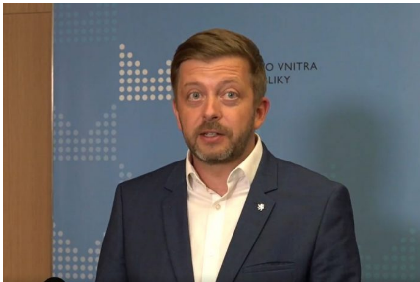
Vít Rakušan, ministr vnitra a gestor návrhu zákona na blokování závadových webů

Tím byly myšleny např. utajované materiály bezpečnostních služeb, pokud by unikly a nějaký server by se rozhodl je publikovat. Už před prázdninami ale přicházely náznaky, že těmto slibům nelze věřit, a že půjde o drakonický zákon, který bude blokovat naprosto veškeré a vládě nepohodlné informace. Po prostudování článku na Aktualne.cz můžeme prohlásit, že je to ještě horší než jen drakonické. Je to naprostá informační genocida, naprosté vymazání všech informací, které přijdou od oficiálních médií z největšího státu na světě.