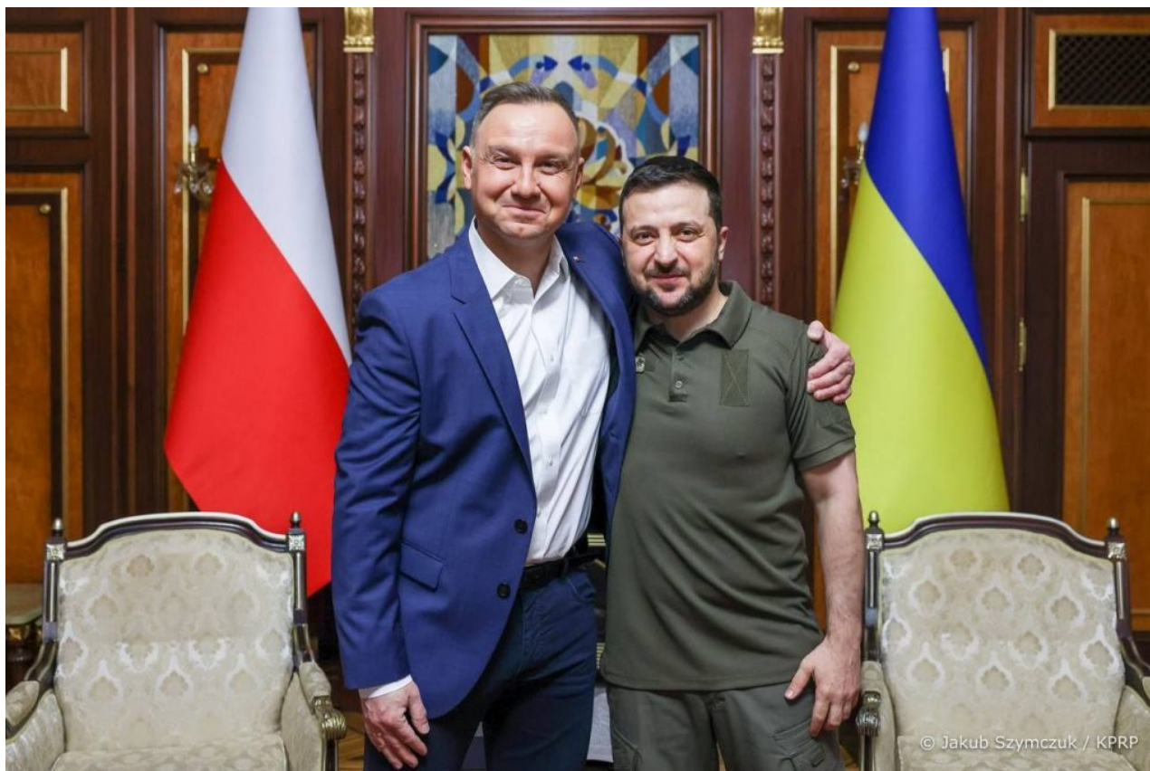
Andrzej Duda a Zelebuben

A samozřejmě se to netýká státních zaměstnanců a těch, kteří mají to štěstí, že mají nějakou práci na slušné úrovni. Stejně jako v Libanonu, ani v Mexiku vláda nekontroluje menší města a obce, které jsou pod nadvládou drogových kartelů. A přesně tento model se dá očekávat u Malé Ukrajiny, kde začnou vznikat kartely, které se budou zabývat nejen pašováním lidí do EU, ale i obchodem s lidským masem, protože to bude obrovský kšeft. Malá Ukrajina nebude mít uhlí, ani ropu, ani obilí, ani těžký průmysl, ale bude mít spoustu lidí, které půjde vytěžit na orgány.