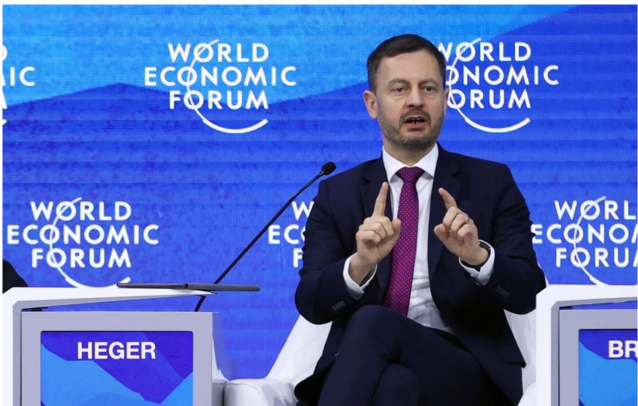
Eduard Heger jako host Klause Schwaba na Ekonomickém fóru v Davosu 2022

Před pár týdny skončil [2] jeden z největších metalurgických podniků v zemi, a to koncern Slovalco, největší zpracovatel hliníku na Slovensku, jehož provoz spotřebovával téměř 10% veškeré elektřiny v zemi. Podle Hegera je zapotřebí, aby Evropská unie uvolnila na zastropování cen energií v Evropě mamutí balík 5 miliard EUR z fondu rozvoje, přičemž předchozí balík určený na stropování cen energií v EU by měl být rozdělený mezi země EU rovnoměrně, z čehož by Slovensko mělo asi 1,5 miliardy EUR.