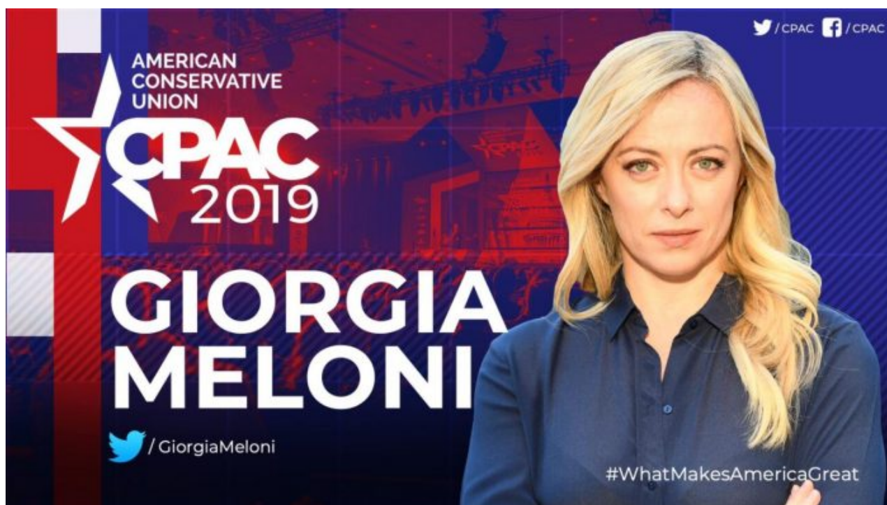
Giorgia Meloni vystoupila v roce 2019 na CPAC

A tím je jasně dané, odkud vítr fouká. A tady bychom článek mohli ukončit, že je řečeno úplně vše. Jenže něco ještě zůstalo. Je to nacifikační linka v Evropě, která se táhne od kanálu La Manche až na frontovou linii na Donbasu a další stejná linka se táhne od Sicílie až po Bergen v Norsku. Celá Evropa prochází mohutnou etapou poválečného revizionismu po II. sv. válce a hlavními strůjce je americký Deep State, de facto americká obdoba Říšského kancléřství a Vůdcova válečného stanu.