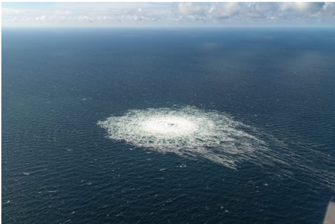
Unikající plyn na mořské hladině po zničení plynovodu Nord Stream 2

Informace se ven zjevně dostat neměla, minimálně ne teď v této době. Jak může německá tajná služba vědět, že plynovody již nepůjde opravit? BND se snad šla na to potrubí již podívat, agenti BND navlíkli skafandry a zkontrolovali stav plynovodů na mořském dně? A to zvládli jen pár hodin po explozích, tak rychle?