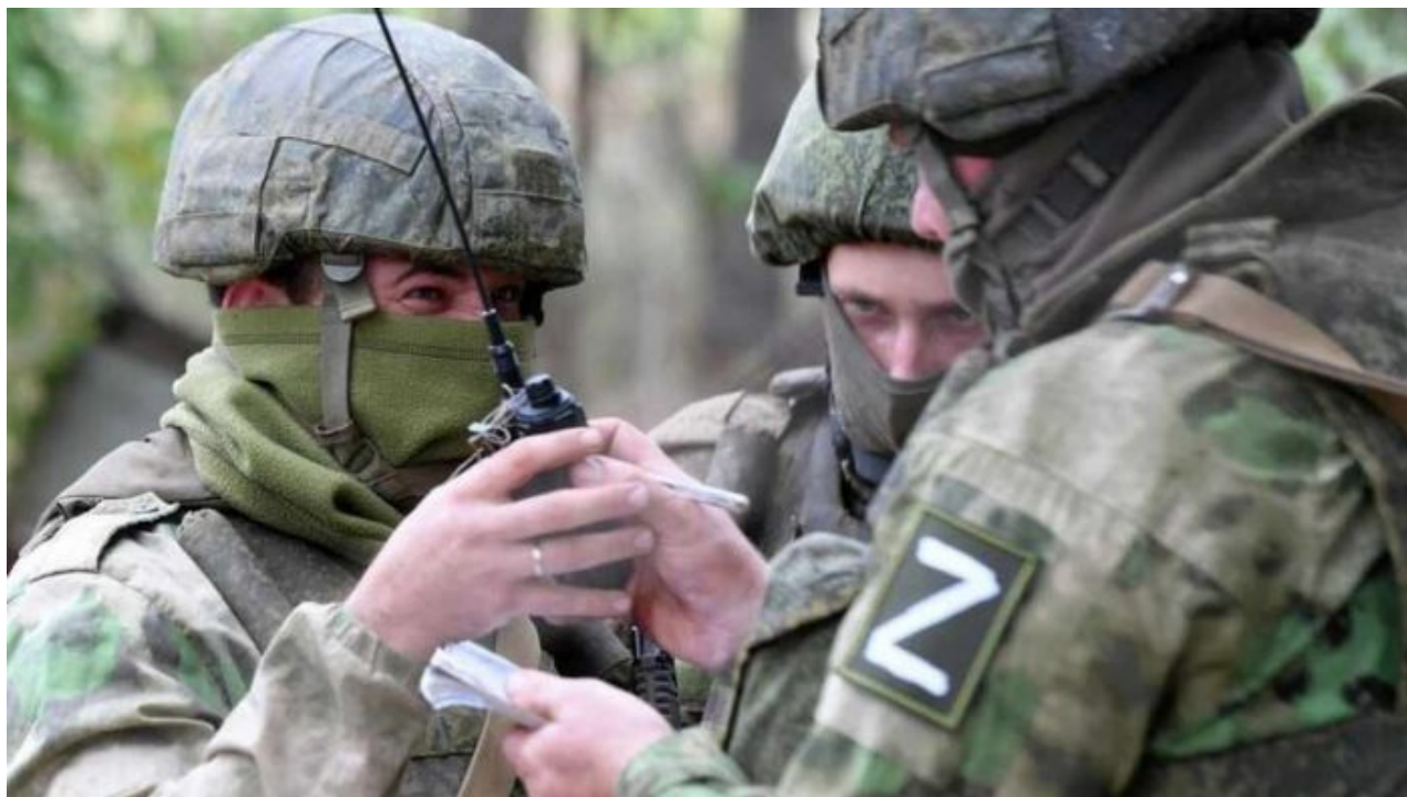
Zaščitníci Ruské armády

A jak by na to reagoval Pentagon, to je ve hvězdách. Média na Západě tak pro jistotu již vypouští mobilizační informační balóny pro obyvatelstvo. Fiala je připraven vyhlásit válečný stav, o tom se nepochybuje již od února, kdy po ruské invazi začal profesúrek šermovat v médiích možností válečného stavu. A právě s ním je spojena mobilizační povinnost, která může být částečná nebo úplná. Neberte to na lehkou váhu. Teď už to není v rovině teoretických vzdálených úvah, teď už jen máme výčet jasně a Putinem na jedné a Západem na druhé straně na stůl předložených možností.