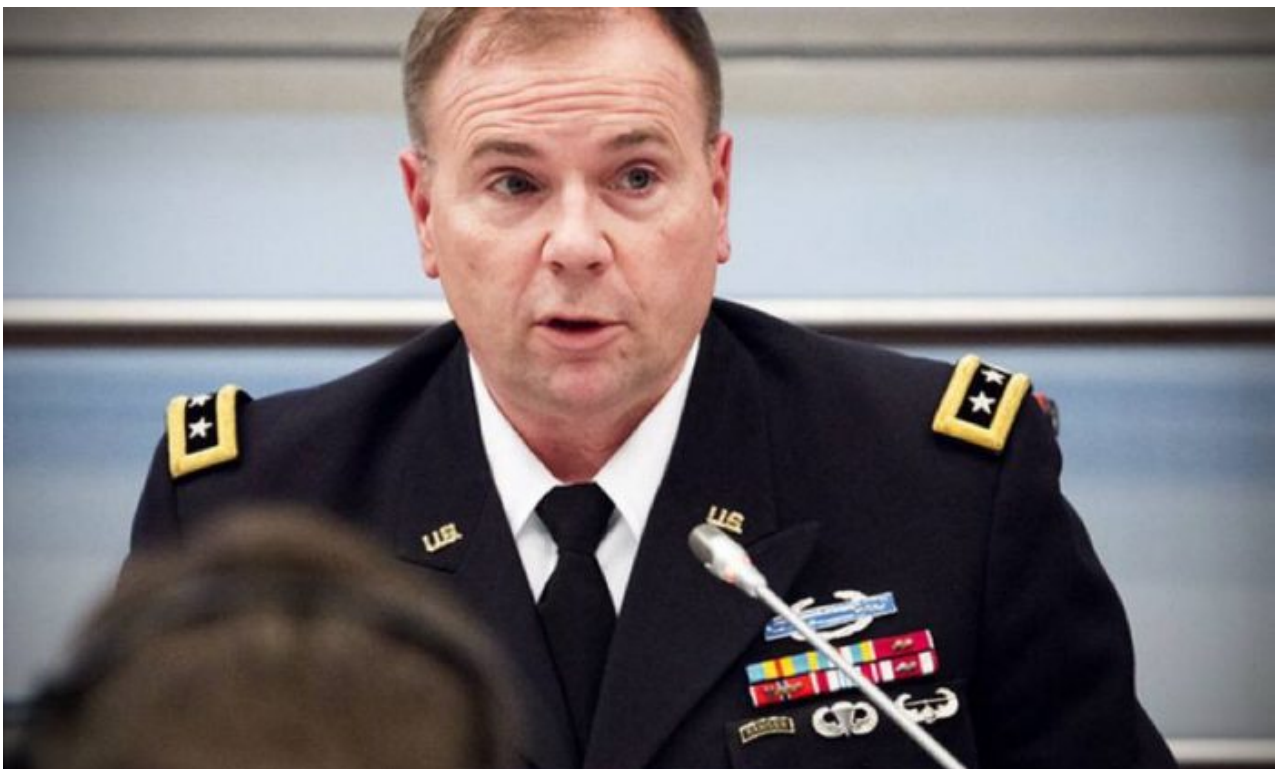
U.S. Gen. Ben Hodges

Tento scénář nabývá hrozivých obrysů, protože světoví investoři stahují své akcie a investice z Evropy. Prodávají nemovitosti, vily, jachty a přesouvají majetek do USA. A bývalý (naštěstí bývalý) velitel amerických vojsk v Evropě Gen. Ben Hodges ve středu prohlásil [1], že pokud Rusko použije na Ukrajině jaderné taktické zbraně, americká armáda prý odpoví zničením ruské černomořské flotily. To by vedlo k plné a neomezené jaderné výměně mezi Ruskem a USA.