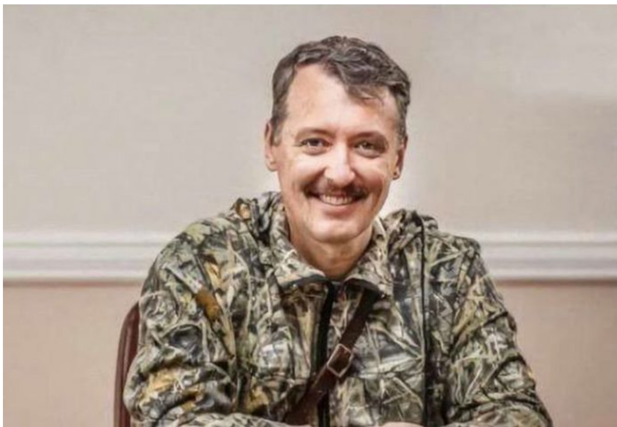
Igor Girkin – Strelkov

Ruská armáda vytvořila na Ukrajině frontu, která je dlouhá přes tisíc kilometrů a Rusko nemá v současné době dostatek personálu ani na ochranu frontové linie, ani na kontrolu vnitřního obsazeného území. Šojgu oznámil, že Ukrajina přišla o zhruba 61 000 vojáků a dalších zhruba 50 000 jich bylo zraněno. Ruská armáda podle slov ministra přišla o 6 000 vojáků. Co je ale zásadním poznatkem, to je odhalení účelu mobilizovaných rezervistů.