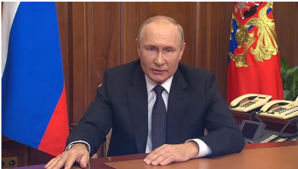
Vladimir Putin během projevu vyhlášení částeční mobilizace

Pokud je bitka nevyhnutelná, je potřeba udeřit první. Tento Putinův citát nyní dostává na síle a významu. A to platí i o použití jaderných zbraní na obranu ruského území, v té době tedy již ruského území připojeného od Ukrajiny. Přesně takto Vladimir Putin bude uvažovat. Bitka se Západem je nevyhnutelná. A pokud je nevyhnutelná, potom se neomezí jen na konvenční zbraně, ale rozšíří se i na jaderné. Protože Rusko by se plnou mobilizací zřejmě postupně rozvrátilo. Putin není Stalin, aby terorem udržel poslušnost milionů Rusů hnaných do války. Sami Rusové by s tím nesouhlasili a chtěli by, aby Putin použil jaderné zbraně místo milionů ruských obětí v konvenčním střetu.