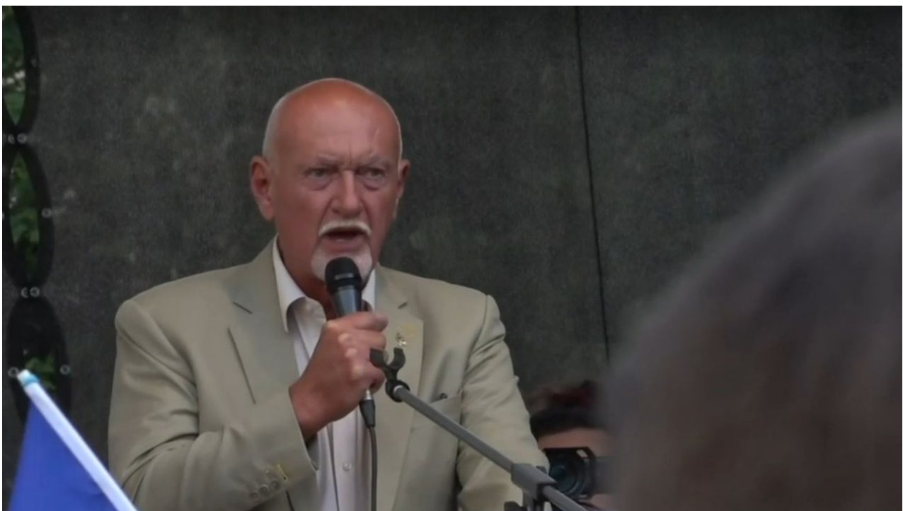
Gen. Hynek Blaško na 100-tisícové demonstraci 3. září 2022 v Praze

Je to neuvěřitelné, ale po čase se nám znovu vrací staronový příběh o SPD a zhrzených bývalých členech, kteří najednou vychází s informacemi na povrch. Obrovský otřes nyní zažilo Hnutí SPD Tomia Okamury, jehož řady ve středu večer oficiálně opustil jejich europoslanec a generál Hynek Blaško. Generál, kterého naše redakce v roce 2019 otevřeně podpořila a vyzvala k jeho volbě při volbách do Evropského parlamentu a po mohutné kampani na sociálních sítích se nám podařilo pana generála dostat z 8. místa na jedničku a k vítězství ve volbách za SPD, ve středu večer rezignoval na své členství v SPD a na svém profilu na Facebooku uveřejnil [1] veřejný rezignační list adresovaný přímo Tomiu Okamurovi. Co se určitě teď začne z SPD ozývat, to bude řev, že je to od pana generála účelovka před volbami.