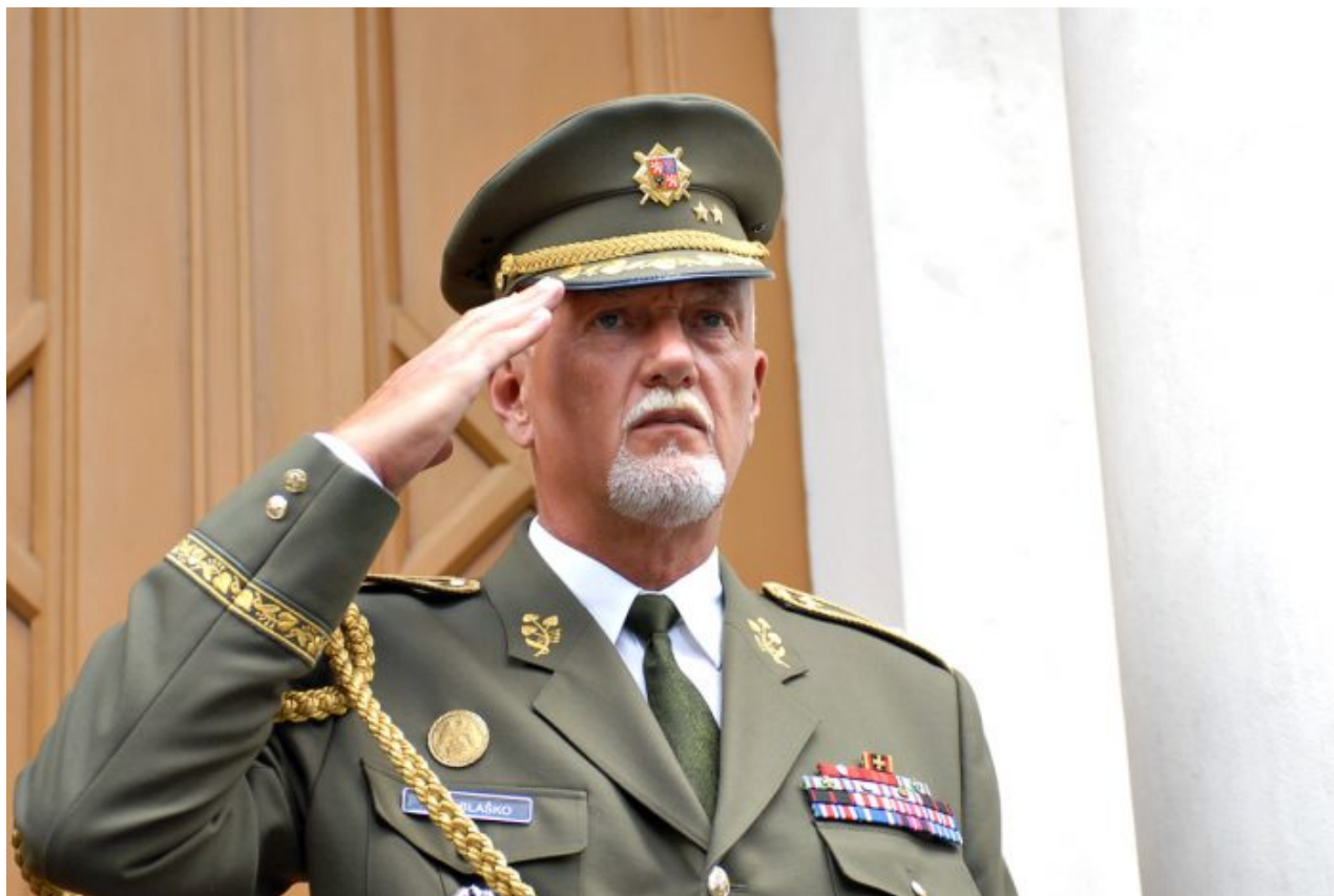
GenMjr. Hynek Blaško v uniformě