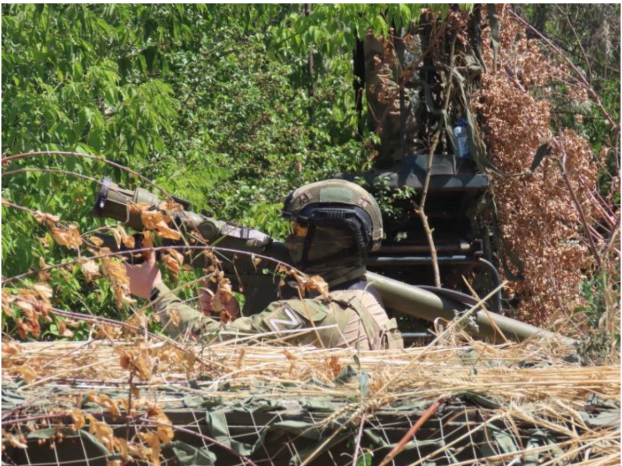
Ruský voják na Ukrajině s protitankovým granátometem

A po 4 měsících seřadí v Charkovské oblasti, podle Komsomolské pravdy, ukrajinská armáda 50 000 ukrajinských vojáků se stovkami kusů těžké techniky ze Západu a ruský štáb v Kupjansku na to nijak nereaguje a neposiluje obranu. Podle informací, které unikají z prostoru bojů do ruských sociálních sítí, se ukazuje, že v době ofenzívy na Balakleju měla Ruská armáda na pozicích jen pouhých 7 500 vojáků. Na ně se hrnula 50 000 ukrajinských vojáků! Díky fortifikaci a dělostřelectvu se i přesto ruští vojáci dokázaly na okraji města bránit a zamezovat ukrajincům vstupu do města po dobu 2 dnů.