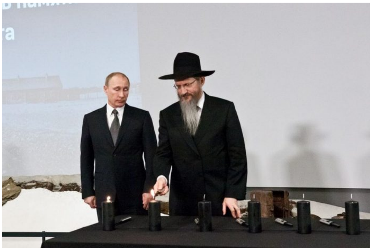
Vladimir Putin a Berel Lazar

izraelské a britské cestovní pasy. Fjodorov mluví o zrádcích a mnoho jich podle všeho pochází právě z obou židovských organizací tak úzce napojených na Kreml z obou stran.