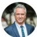
Robert Kennedy Jr USA