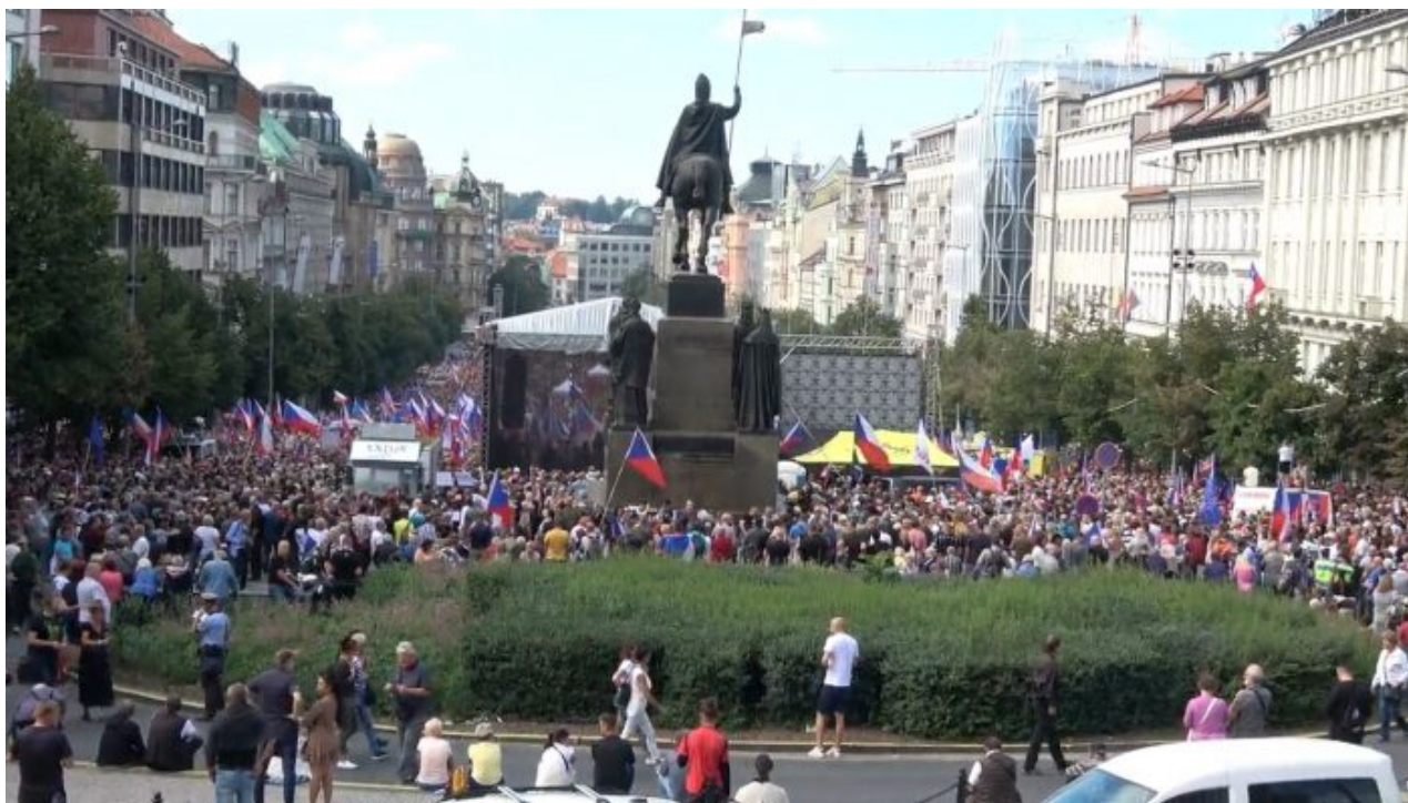
Demonstrace 3. září 2022 v Praze

Dva neznámí kluci z Milionu chviliek vs. Dva neznámí kluci ze 100-tisícové demonstrace na Václaváku Nejhorší situace přitom nastane příští rok v únoru a v březnu, až začnou lidem v ČR chodit roční vyúčtování za elektřinu a plyn. Tam nastane bezpečnostní krize v ČR, kterou si dnes nedovedeme ani představit. A debilní provokační výroky premiéra proti občanům, kteří nemají na zaplacení faktur za energie, že prý jsou proruští švábi a agenti Kremlu v ČR, skutečně způsobují vztek a zlobu mezi občany, protože jim dochází, že premiér je hňup. A v dnešní době hňup v čele vlády znamená národní katastrofu. Požadavky po Fialově demisi jsou tudíž zcela na místě. Už včera bylo pozdě!