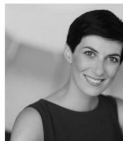
Markéta Pekarová Adamová