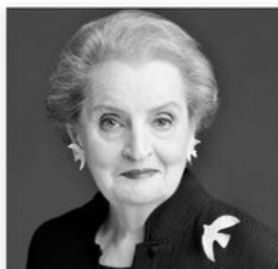
Madeleine Albright Honorary Co/Chair of the US Aspen Board