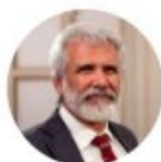
Dr. Robert Malone USA