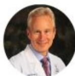
Dr. Peter McCullough USA