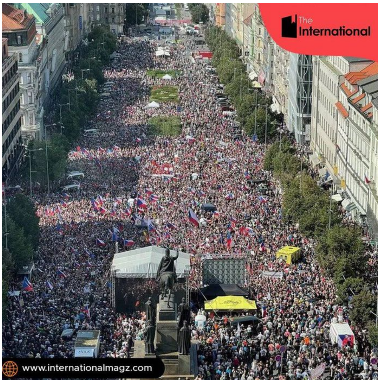
Demonstrace ČR Na prvním místě, Praha, 03. 09. 2022

Demonstraci překvapivě nikdo nenarušoval a nerozbíjel. Nikde nezněly vuvuzely a policie ukázkově oddělovala příznivce NATO a EU na schodech Ukrajinského muzea , to je ta budova s ukrajinskou vlajkou nahoře nad magistrálou. Vůbec snad poprvé v historii přenos a živé vysílání zajišťovaly velké mainstreamové servery jako jsou Seznam Zprávy nebo Novinky, mediální podporu demonstraci zajistily i deníky Metro a iDNES.CZ z konsorcia Agrofertu.