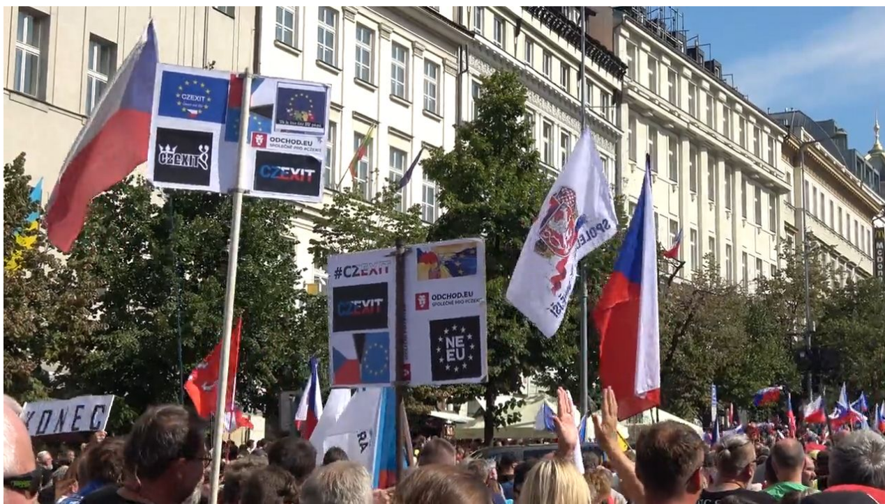
Transparenty na demonstraci

No přece k tomu samému, k čemu právě dochází v Polsku. Amerikanizace Polska došla tak daleko, že Polsko naprosto senzačně v pátek prohlásilo, že zažaluje Německo o vyplacení válečných reparací v přepočtu ve výši 32 bilionů korun. K čemu došlo? Je to samozřejmě hra americké státní moci, která se skrze Polsko snaží oslabit Německo v Evropě. Německo se snaží zachovat vztahy s Ruskem, alespoň na tajné a minimální úrovni, a proto Američané se snaží v krizi se potácející Německo dorazit obrovskou arbitrází o reparace Polsku. A nedivil bych se, že Petr Fiala teď bude mít velké dilema, jestli by se neměl připojit, jenže to by bylo velmi těžké. Pětikoalice je úzce provázána na německé zájmy, na Sudetoněmecký landsmančaft atd.