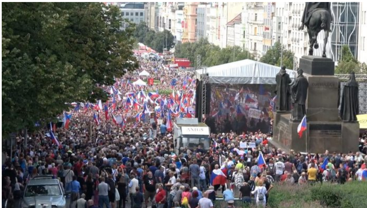
Záběry na demonstraci od muzea

Toho se rozhodně s generálem a jeho fanatickou protiruskou agitkou nikdo nedočká. Volba prezidenta tak nebude o volbě prezidenta, ale znovu o volbě stavu a obsahu nákupního vozíku, kde lidem bude v listopadu a v prosinci už chybět daleko víc, než jenom levná elektřina a plyn. Je-li na nákupní frontě válka, občané přestanou ctít barvu politických dresů a budou se rvát o zbytek zboží na skladě a o to, kdo to zboží dokáže lépe zajistit. Protesty nespokojených lidí jsou přitom v Evropě ojedinělé. Většinu velkých protestů organizují nadnárodní trusty a neziskovky v čele s Open Society.