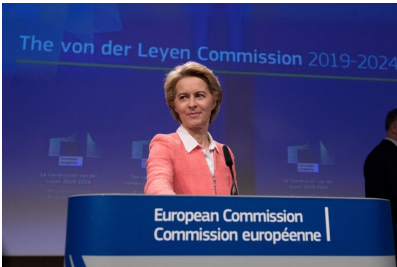
Ursula von der Leyen

Ursula von der Leyen přitom společně s Petrem Fialou nehorázně lžou a dezinformují obyvatelstvo EU, až se jim od huby práší. Ceny plynu a ropy na koncovém spotřebitelském trhu v EU neurčuje Rusko svojí velkoobchodní nabídkou obou surovin, protože tato velkoobchodní cena je zanedbatelná ve srovnání s tzv. maloobchodní, tedy retailovou cenou. Retailovou cenu plynu a ropy určují evropské burzy, a to konkrétně v Amsterdamu (plyn) a ve Frankfurtu a v Rotterdamu (ropa). Na těchto burzách se plyn a ropa spekulativně obchoduje, a to nezávisle na velkoobchodní ceně ruské ropy a plynu.