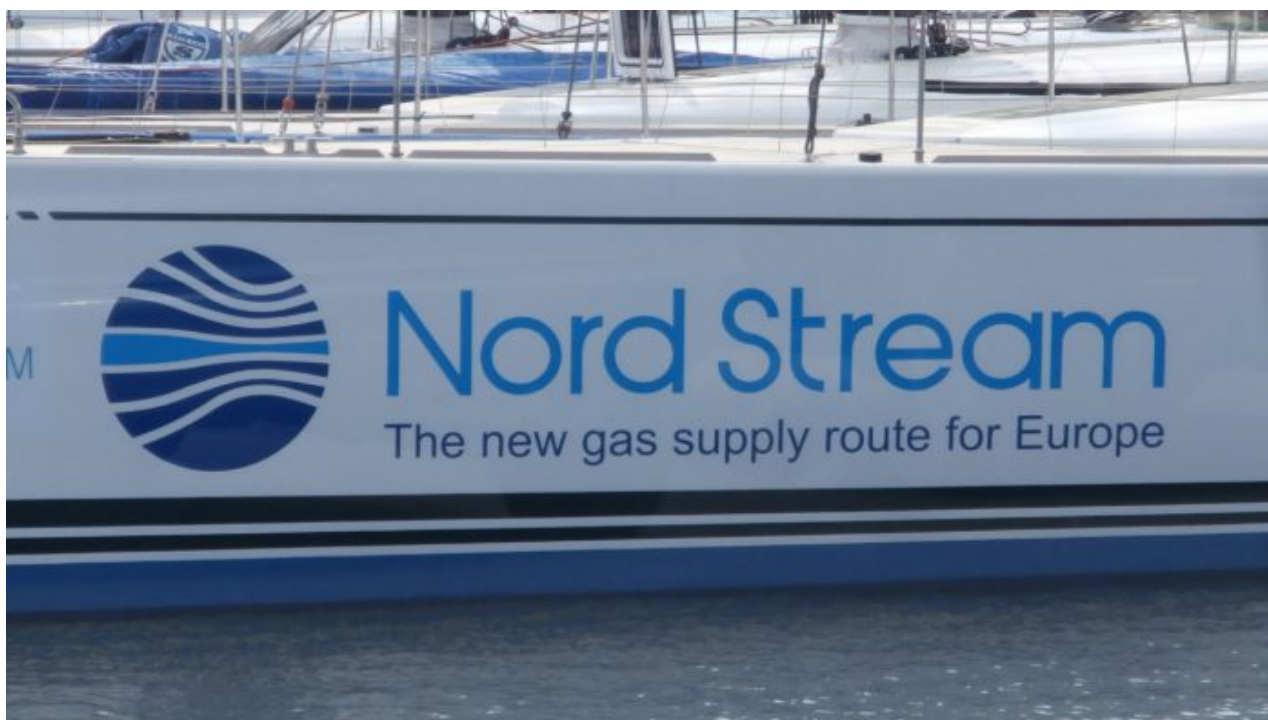
Plynovod Nord Stream 1

výrobci potravin je obrovská a mamutí konkurence. A když výrobce odmítne dodat produkci za nižší cenu, řetězec mu zruší smlouvu a nahradí výrobce jiným dodavatelem. Jenže v případě ropy a plynu to fungovat nebude. V Evropě neexistuje kromě ruského plynu a ruské ropy nikdo další, kdo by uměl dodávat tak velké objemy surovin za tak přijatelné ceny jako Rusové.