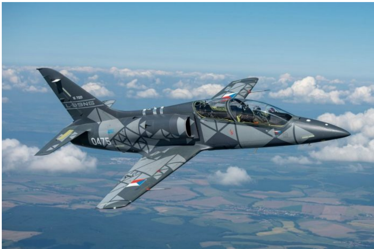
Český frontový lehký bitevník Aero L-39NG za přibližně 9,5 milionu USD