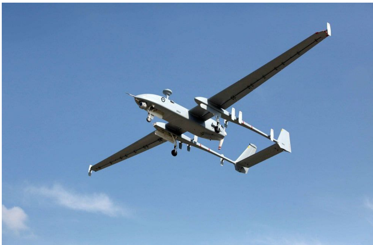
Izraelský dron Heron za cca. 35 milionů USD

Pouhé 3 drony jsou strašně malý počet pro potřeby armády a vzhledem k astronomické ceně za jeden kus to spíš vypadá jako kšeft, který má více politický než vojenský rozměr a jeho úkolem je posílit vztahy s Izraelem. Přesně takto nás do redakce informoval náš zdroj, že nákup představuje utužení dobrých vztahů s Tel Avivem, i když postrádá vojenský význam, protože 3 drony nelze považovat za smysluplnou vojenskou akvizici.