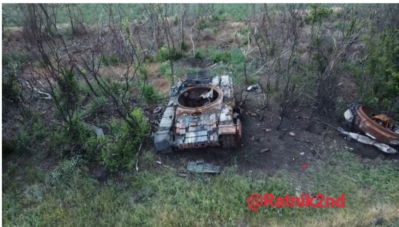
Výsledek ukrajinského pokusu o ofenzívu v Chersonu: zničený ukrajinský T72-B dodaný Polskem

Pokud se ale Ruská armáda nestáhne, ukrajinská armáda nemá sílu Rusy z pozic vojenskou silou vytlačit. Ruská armáda přitom linii chrání opravdu jen s velmi malým počtem vojáků, protože Kreml se chce za každou cenu vyhnout draftu, tedy povoláváním záloh do války, protože chce operaci na Ukrajině udržet jen v rukách profesionálních vojáků a dobrovolníků. Roztažení Ruské armády je tak opravdu značné a na některých úsecích připadá dokonce jen 1 ruský voják na 2 kilometry frontové linie a situace je monitorována ruskými drony 24 hodin denně.