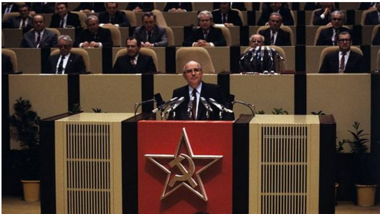
Michail Gorbačov v Praze v Paláci kultury dne 10. dubna 1987

Jak už jsem dříve napsal a jak tvrdí i Kissinger, USA mohou vést válku proti Číně, nebo proti Rusku, ale ne proti oběma současně. Ale to je už jiný příběh. Rozbití systému Pax Americana bouracím kladivem muže v bílém klobouku bylo započato. Michail Gorbačov a Donald Trump tak mají jedno společné. Společně pomohli rozbourat své státy zevnitř s cílem ukončení jejich světovlád a systémů řízení. To byla a je role bílých klobouků, nic víc, nic míň. Ano, chápu, někomu teď spadly hodiny ze zdi, ale taková je konceptuální realita. Když někdo zevnitř bourá svoji zemi, její ukotvení, její světovou moc, tak se neptejte, proč to dělá, ale ptejte se, kdo bude na staveništi po odvezení sutin stavět nový projekt. Právě ten je totiž tím, kdo najal, zaúkoloval a řídil bourače s kladivem.