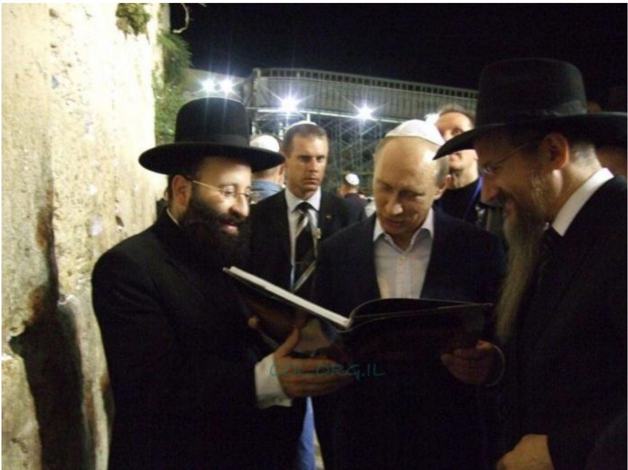
Ruský prezident Vladimir Putin dosazený do Kremlu Ruským židovským kongresem

To spískal Boris Jelcin, alkoholik, konceptuální tragéd, který si neuvědomoval, že Sovětský svaz byl rozložen ne kvůli Západu, ale kvůli návratu Ruského židovského kongresu k moci, kterou ovládal v dobách cara Mikuláše II. To byl ten hlavní plán a projekt instalace Michaila Gorbačova do funkce bílého klobouku, tedy destruktora procesů řízení zevnitř! A to je funkce bílých klobouků!