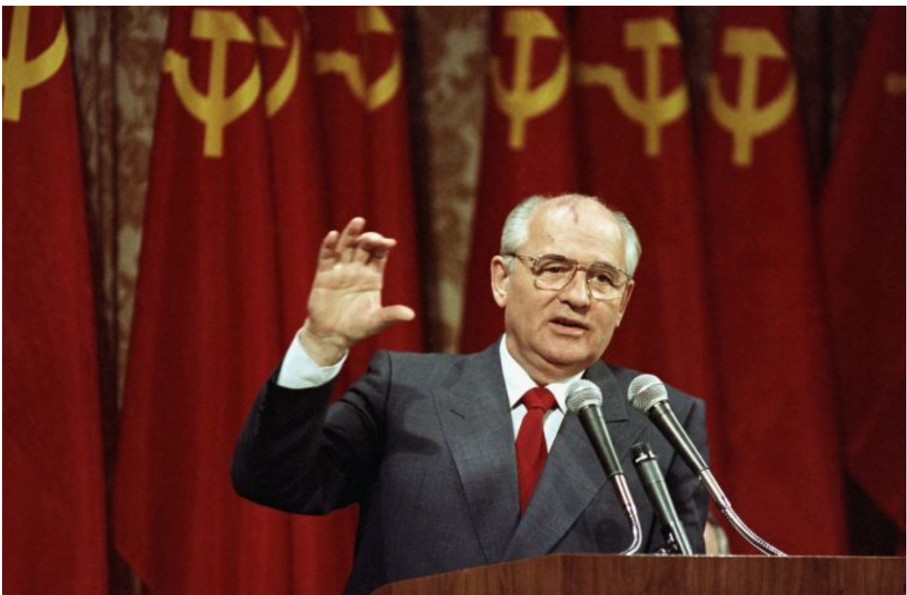
Michail Gorbačov, generální tajemník ÚV KSSS

V úterý 30. srpna 2022 zemřel Michail Gorbačov, poslední generální tajemník Ústředního výboru Komunistické strany Sovětského svazu a současně první a poslední prezident SSSR, protože funkce prezidenta byla ustanovena až v roce 1988, ve které Gorbačov setrval až do rozpadu SSSR v roce 1991. Gorbačov zemřel po dlouhodobé nemoci a podle svědků se jeho zdravotní stav zhoršil po začátku ruské speciální vojenské operace na Ukrajině, když pro média prohlásil, že Vladimir Putin svojí politikou zkazil jeho celoživotní dílo.