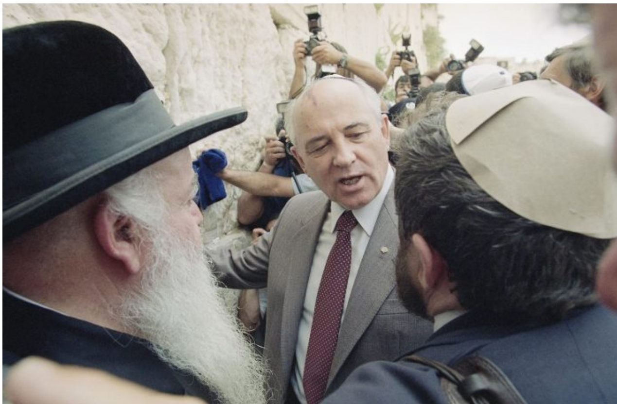
Michail Gorbačov u Zdi nářků v Jeruzalémě dne 18. června 1992

Když Michail Gorbačov koncem roku 1991 odpískal projekt Sovětského svazu, tak se mohlo zdát, že je hotovo. Jenže to rozhodně nebylo. Ve zhrouteném SSSR v Moskvě byl u moci stále Nejvyšší sovět, tedy sovětský parlament s poslanci volenými podle sovětského systému zástupců rukodělného lidu a intelligence , který odmítal přijímat zákony, které mu navrhoval Boris Jelcin, který po Gorbačovovi se ujal funkce prezidenta.