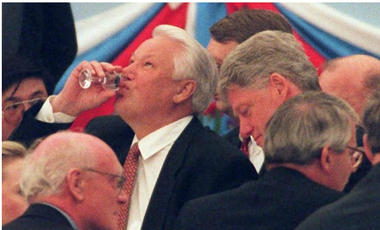
Boris Jelcin s Billem Clintonem. Tato fotografie nejlépe vystihuje krizi Ruska po rozpadu SSSR

(vydáním dekretu o půdě), ale zejména jeho nástupce z Gruzie, jistý Džugašvili, který se přejmenoval na “ocelového” muže (Stalin). Jelcin však naplnil plány Rothschildů beze zbytku. Plundrování Velké Rusi jelo jako po másle, zatímco Jelcin nebyl doma a jezdil po světě, kde se opíjel do němoty.