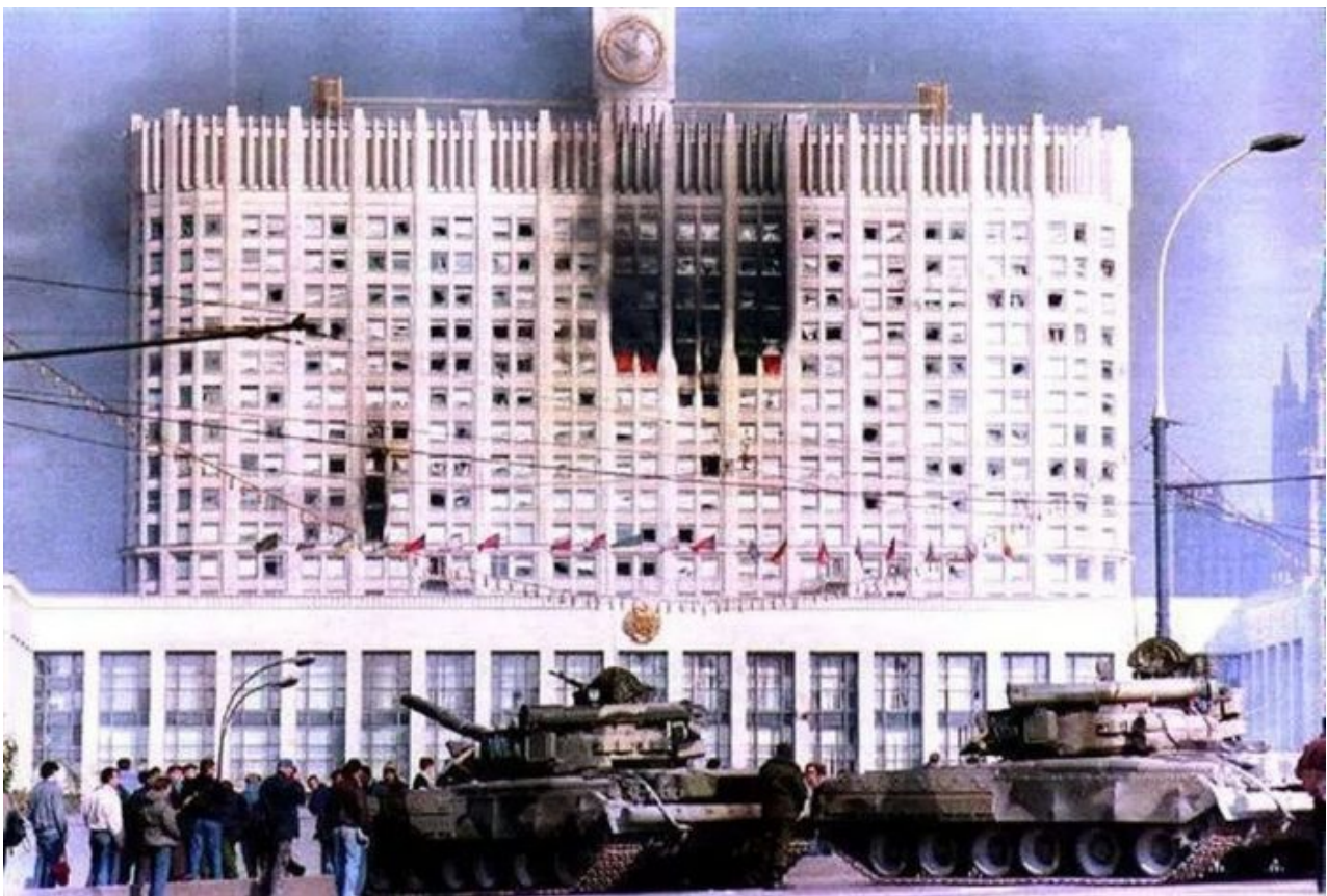
Tanky pod velením Borise Jelcina zaútočily na budovu Nejvyššího sovětu, 4. října 1993

Boris Jelcin po telefonické konzultaci se svým nadřízeným, tedy s americkým prezidentem Billem Clintonem, nařídil Ruské armádě zahájení útoku na Nejvyšší sovět. Ten povolal na obranu rovněž armádu řízenou loajalisty Nejvyššího sovětu. Vojska pod velením Borise Jelcina budovu dobyla a poslanci byli pozatýkáni. Teprve v tom okamžiku skutečně a doopravdy zanikl Sovětský svaz, když Boris Jelcin poslance a zástupce Nejvyššího sovětu rozpustil, aby mu už neblokovali jeho privatizační zákony.