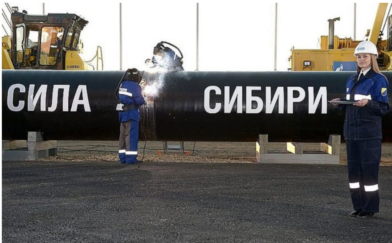
Plynovod Síla Sibíře

A to ve chvíli, kdy čínská ekonomika ten plyn nepotřebuje. Ale potřebuje ho někdo jiný v Evropě. Rusko podle všeho je s Čínou na těchto operacích domluveno. Je to součást taktiky skupiny BRICS. Čína nakupuje ruský plyn, který objektivně nepotřebuje, zkapalní ho a dodá loděmi s vlastní přírážkou do Evropy, rozuměj do Německa. A celé to praskne 29. srpna v pondělí, když ministerstvo průmyslu praskne šokující informací, že stal se zázrak, v zásobnících bude 85% plynu již v září.