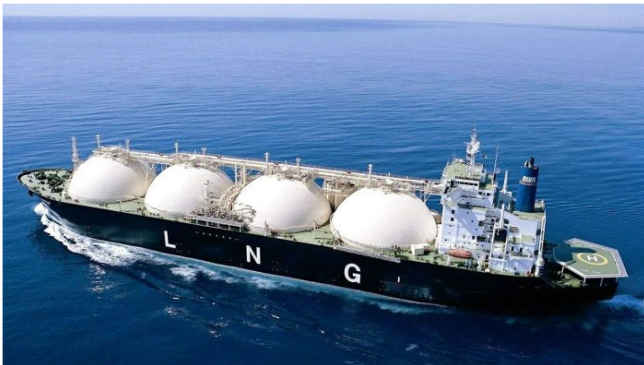
Tanker pro převoz LNG

V červenci server South China Morning Post uvedl [3], že podle údajů čínských celních úřadů Čína v prvních šesti měsících roku 2022 nakoupila od Ruské federace celkem 2,35 milionu tun zkapalněného zemního plynu (LNG) v hodnotě 2,16 miliardy USD. Objem dovozu se meziročně zvýšil o 28,7%, přičemž hodnota vyskočila o 182%. Znamená to, že Rusko předstihlo Indonésii a Spojené státy a stalo se letos čtvrtým největším dodavatelem LNG do Číny!