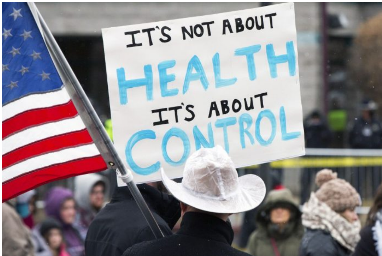
Protest v USA proti povinnosti očkování proti Covid-19

dopravě. Ale pořád to nebude povinné, budou ujišťovat politici, nikdo vás přece nebude nutit chodit osobně na úřady, pořídte si bankovní identitu a můžete s úřady jednat online.