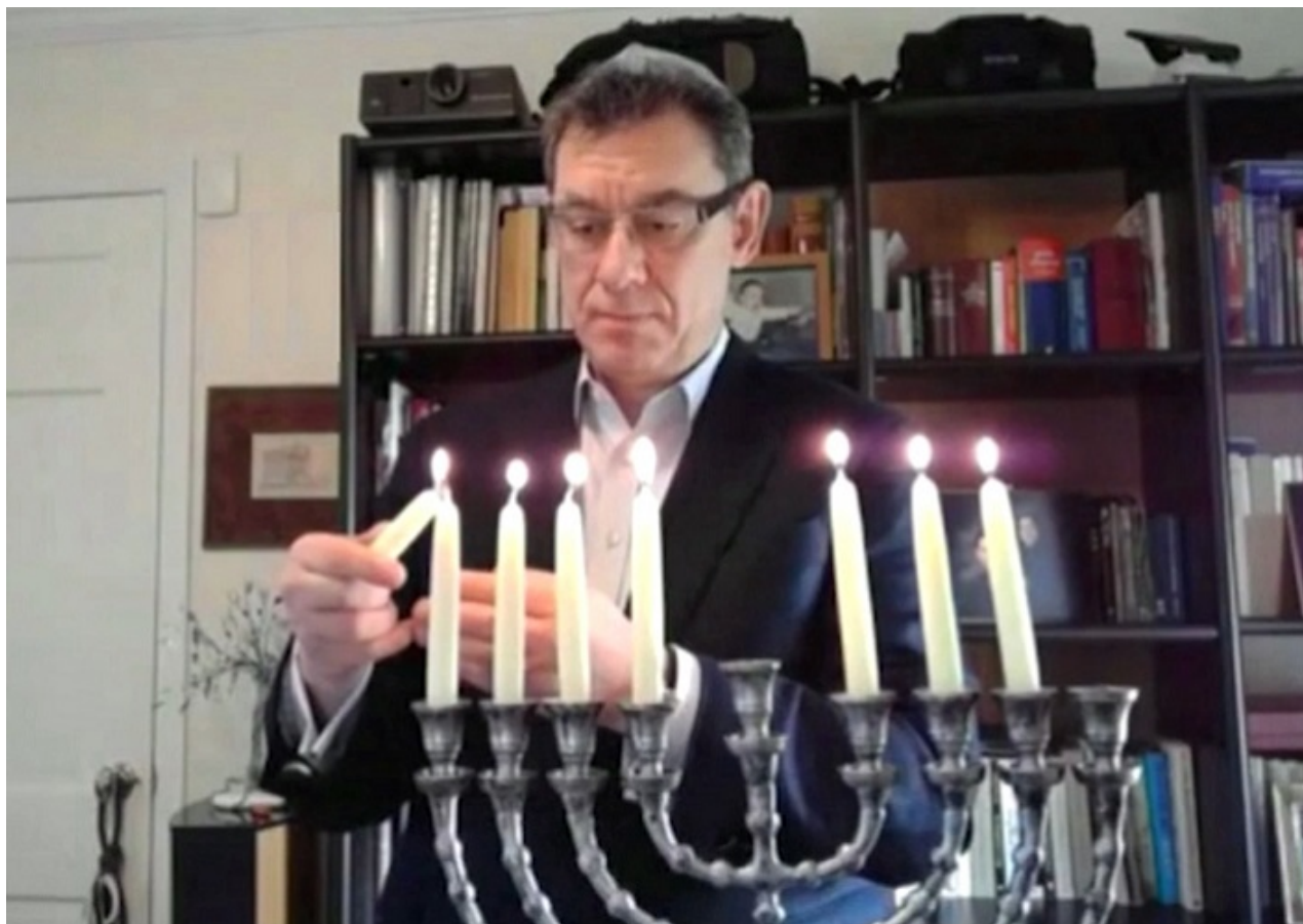
Sefardský Žid Albert Bourla, šéf farmaceutické společnosti Pfizer. Výše mluví o čipu.