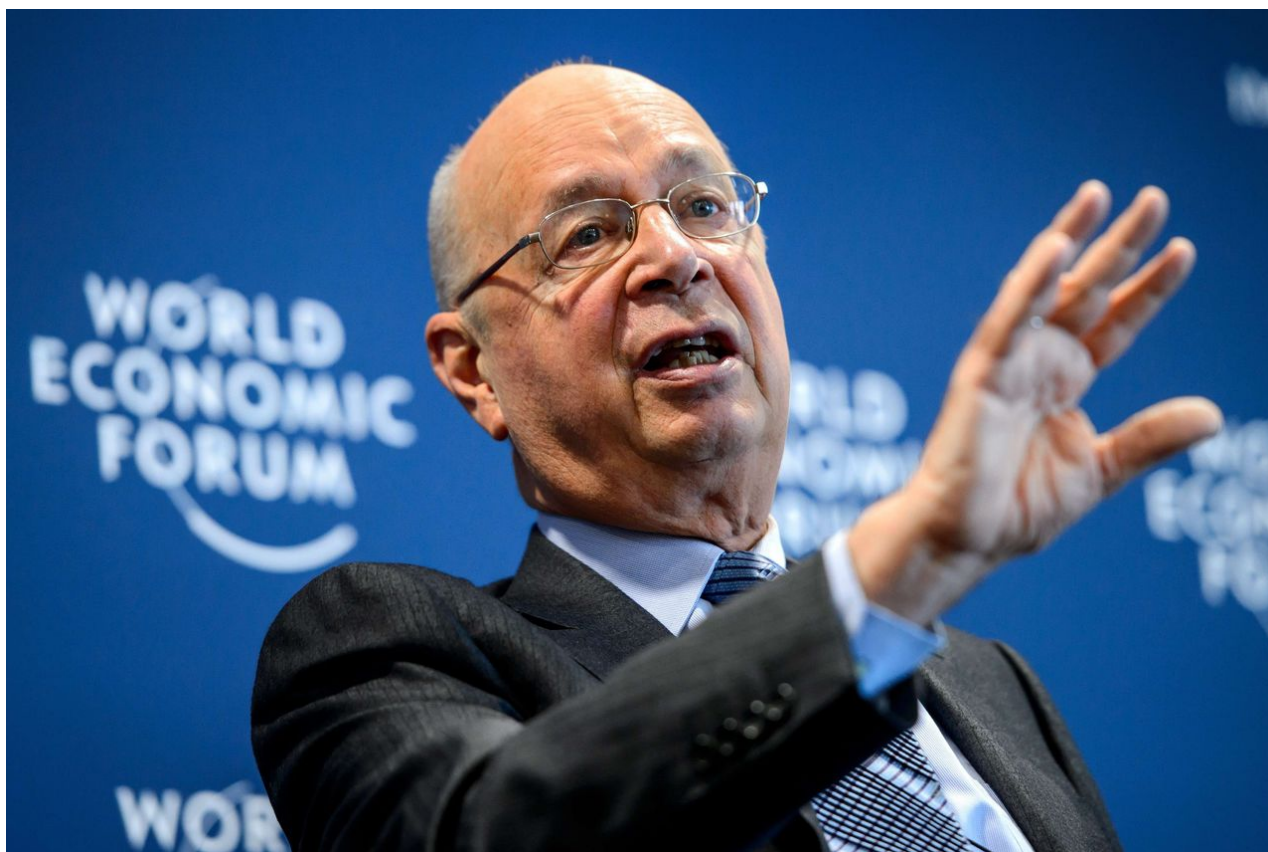
Klaus Schwab, prezident WEF

Z bioniků se stanou nadlidé, protože procesor jim řekne odpovědi na všechny otázky, které najde na internetu. Procesor spočítá sebetěžší matematický příklad a poskytne výsledek, nejprve hlasově do vnitřního ucha, později obrazově přímo do centra mozku, které zpracovává obraz z očí. Výsledek se vám před očima zobrazí jako holografický obraz, který uvidíte jen vy. Lidé postupně začnou nenávidět své biologické části těla, protože podléhají degradaci, chorobám, stárnutí.