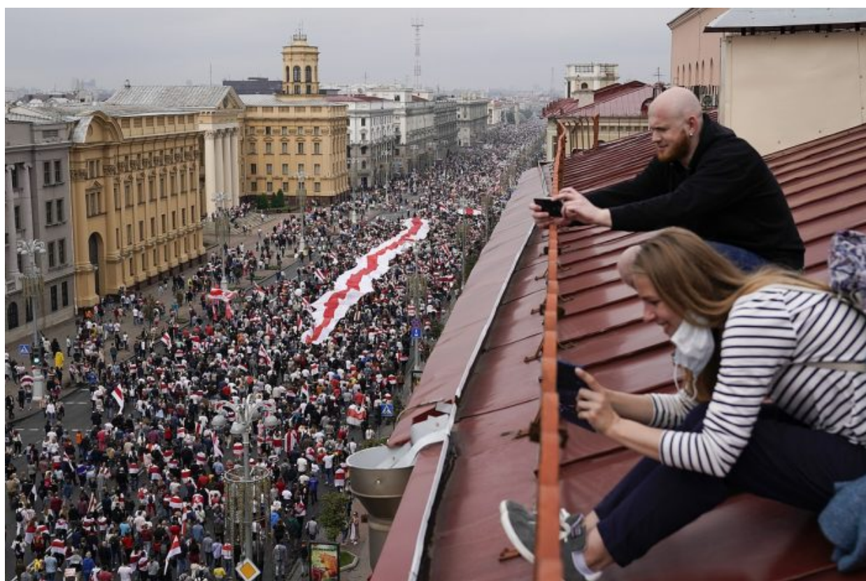
Pokus o Majdan v Bělorusku v roce 2020

Rusové si odhlasovali v plebiscitu odtržení od Ukrajiny na Krymu a posléze i v Doněcké a Luhanské lidové republice. S něčím takovým neokonzervativci v USA nepočítali. To nebylo v plánu. Naopak, byl to moment a okamžik, který začal celý plán na obkličování Ruska hatit, protože se ukázalo, že Ukrajina je pro Rusko nepřekročitelný a nervový bod, přes který vlak nejede a nepojede. V roce 2019 se Američané skrze odbojové skupiny financované a řízené z Polska pokusili svrhnout nově zvoleného prezidenta Alexandra Lukašenka v Bělorusku.