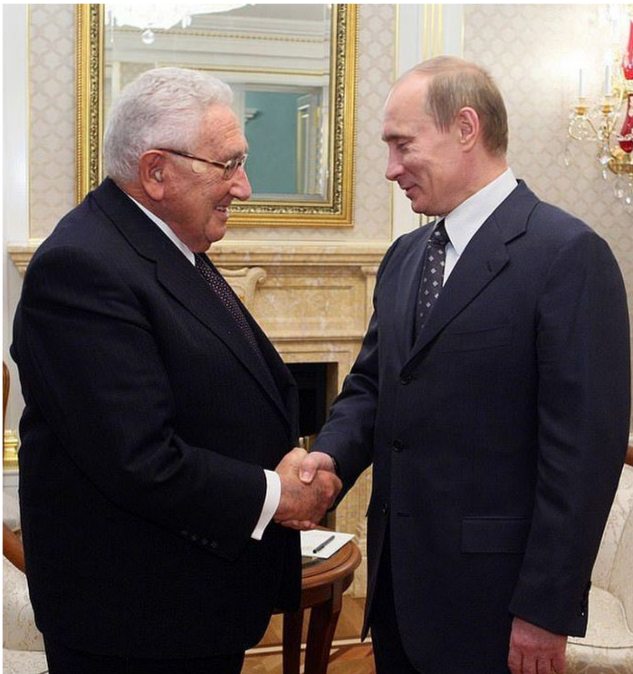
Henry Kissinger s Vladimirem Putinem

Kissinger několikrát prohlásil, že žádná země na světě nedokáže vyhrát válku, pokud nemá dostatek surovin a dostatek průmyslových zdrojů. Oddělené Rusko od oddělené Číny tyto dvě věci nemají, ale společně jimi disponují. Kissinger varuje, že USA si konceptuálně nemohou dovolit mít špatné vztahy s oběma zeměmi. Mohou mít špatné vztahy s jednou z nich, ale ne s oběma. V tomto nelze s Kissingerem jinak než souhlasit. Jenže Kissinger nedopověděl příběh, co se stane, jestli USA v této politice Anti-Ruska a Anti-Číny budou nadále pokračovat. Dopověděl to ale politolog z USA.