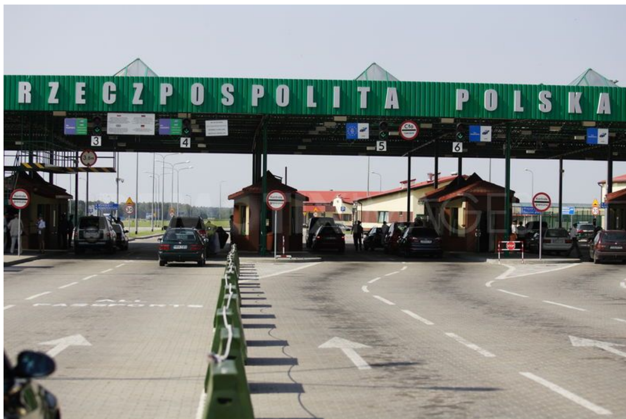
Přechod mezi Polskem a Kaliningradskou oblastí

sebou nese nechtěnou eskalaci, neboť Washington je do války vtažen neočekávanou událostí, která se rychle vystupňuje, možná v důsledku náhodné srážky amerických a ruských bojových letadel. K zásahu by mohlo dojít, pokud Litva zablokuje průjezd sankcionovaného zboží, které prochází přes její území na cestě z Ruska do Kaliningradu, ruské enklávy, která nemá pozemní hranice se zbytkem země.