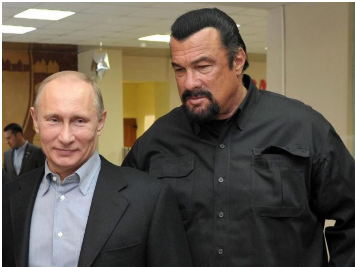
Vladimir Putin a Steven Seagal

Válka na Ukrajině je ve skutečnosti válkou konceptů. Je to střet dvou tezí, na jedné straně neonacistická snaha o návrat k moci v Evropě po II. sv. válce vedená USA, a na straně druhé nástupnická země SSSR, jednoho z vítězů II. sv. války. Rusko jako jediné z vítězných mocností si zachovalo normalitu a ochranu tradiční rodiny. Ve všech ostatních zemích vítězných mocností probíhá likvidace a autogenocida tradiční rodiny. Přešívání pohlaví dětí, LGBT indoktrinace, likvidace postavení svazku muže a ženy, likvidace národních států, likvidace národních vlád a zasévání nenávisti mezi lid a vládu tím, že vlády úmyslně týrají své obyvatelstvo, aby vládu nenávidělo.