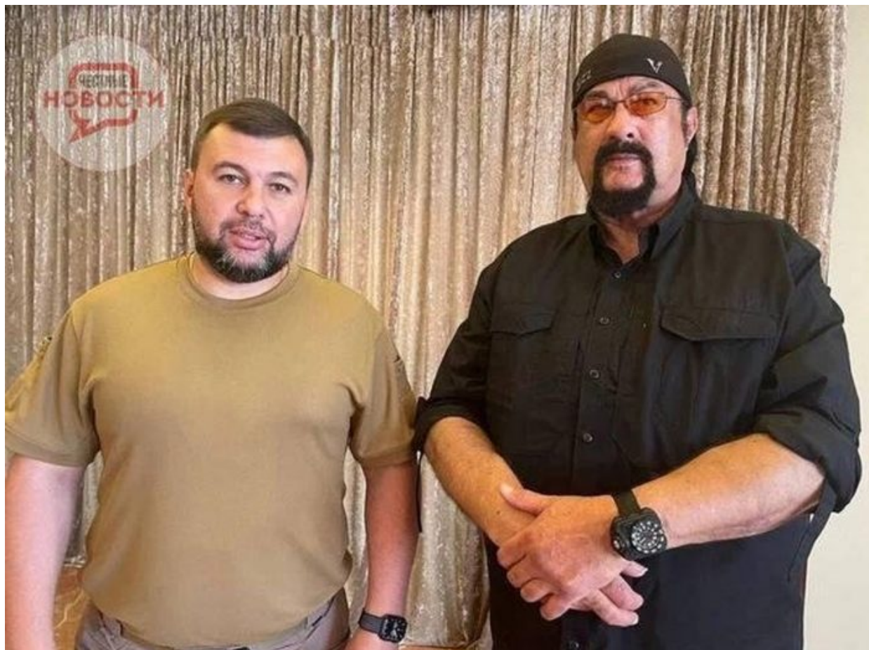
Vůdce DLR Denis Pušilin a Steven Seagal

genderovou rozmanitost v USA a vede k útisku etnických menšin v důsledku bělošské nadřazenosti, kterou ztělesňují a adorují herci “starých časů...” jako je právě Seagal.