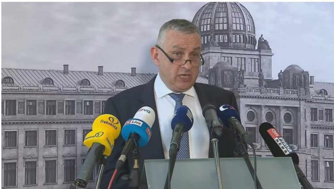
Jozef Síkela, ministr průmyslu a obchodu

(klepeš kosu) žádné předěly mezi chodbou a obývánkem nemají. A teplota 19 stupňů Celsia ve školách pro děti, to snad nebudeme ani komentovat.