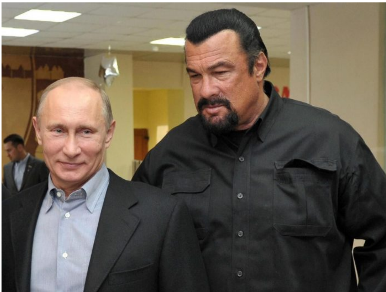
Vladimir Putin a Steven Seagal

Válka na Ukrajině je ve skutečnosti válkou konceptů. Je to střet dvou tezí, na jedné straně neonacistická snaha o návrat k moci v Evropě po II. sv. válce vedená USA, a na straně druhé nástupnická země SSSR, jednoho z vítězů II. sv. války. Rusko jako jediné z vítězných mocností si zachovalo normalitu a ochranu tradiční rodiny. Ve všech ostatních zemích vítězných mocností probíhá likvidace a autogenocida tradiční rodiny. Přešívání pohlaví dětí, LGBT indoktrinace, likvidace postavení svazku muže a ženy, likvidace národních států, likvidace národních vlád a zasévání nenávisti mezi lid a vládu tím, že vlády úmyslně týrají své obyvatelstvo, aby vládu nenávidělo.