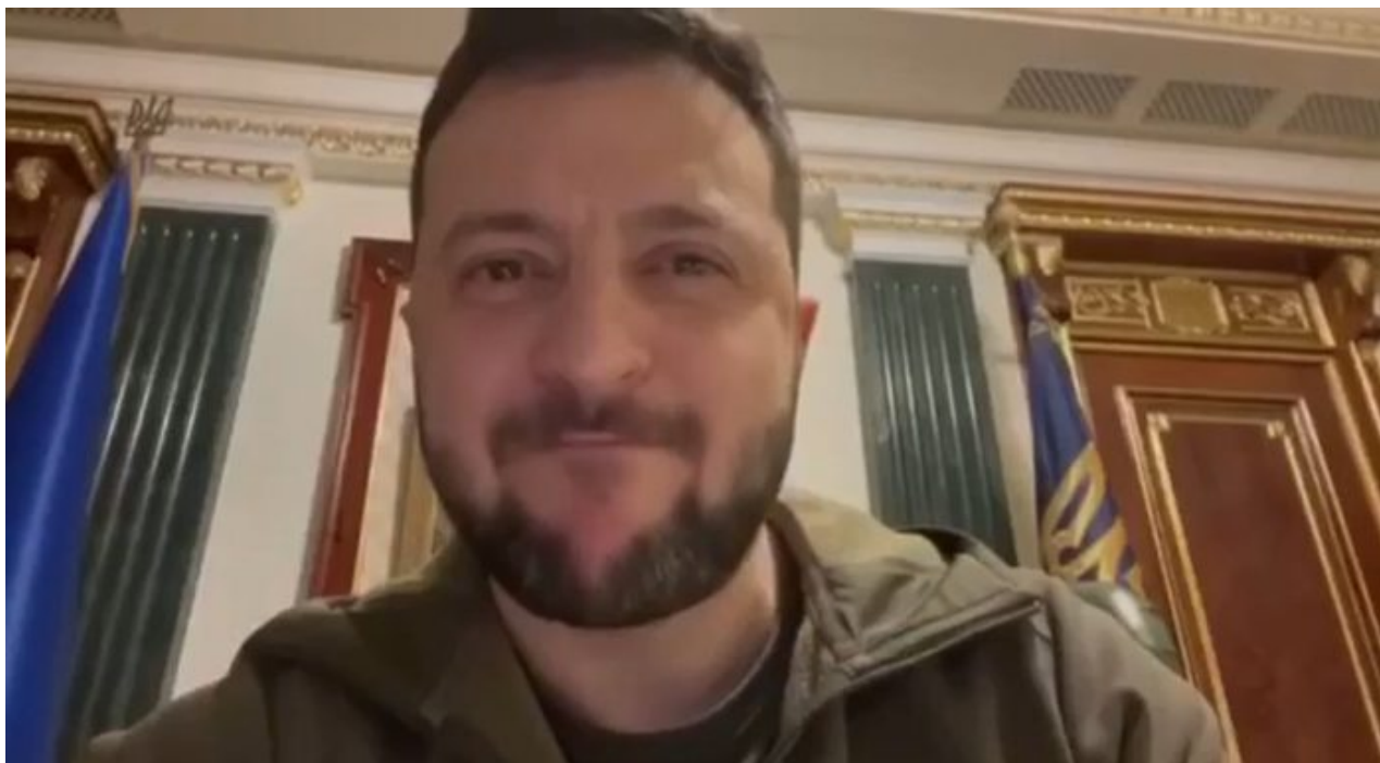
Zelenský s kokešem pod rty během večerního streamu

Co je však nejzásadnější, to je podle Solovjova informace vyšetřovatelů, že vrcholní členové Azovu jednali se Zelenským v mnoha případech v Polsku a nikoliv v Kyjevě. To pouze potvrzuje, že Polsko je do války zapojeno více, než se dosud myslelo. Azováci tak mají pro Kreml tisíckrát větší cenu jako živí než jako mrtvoly, protože mají být korunními svědky proti Zelenskému.