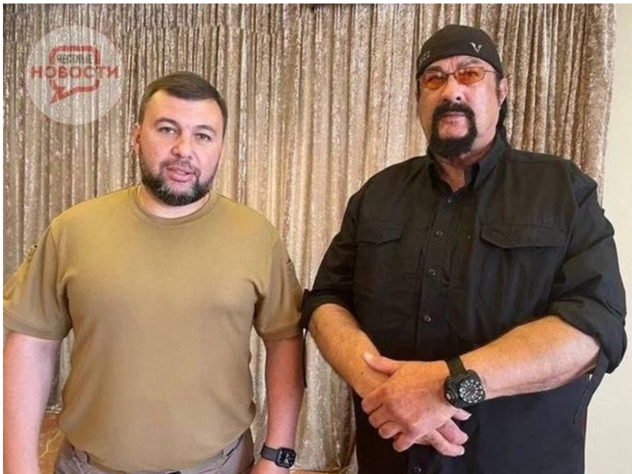
Vůdce DLR Denis Pušilin a Steven Seagal

genderovou rozmanitost v USA a vede k útisku etnických menšin v důsledku bělošské nadřazenosti, kterou ztělesňují a adorují herci “starých časů...” jako je právě Seagal.