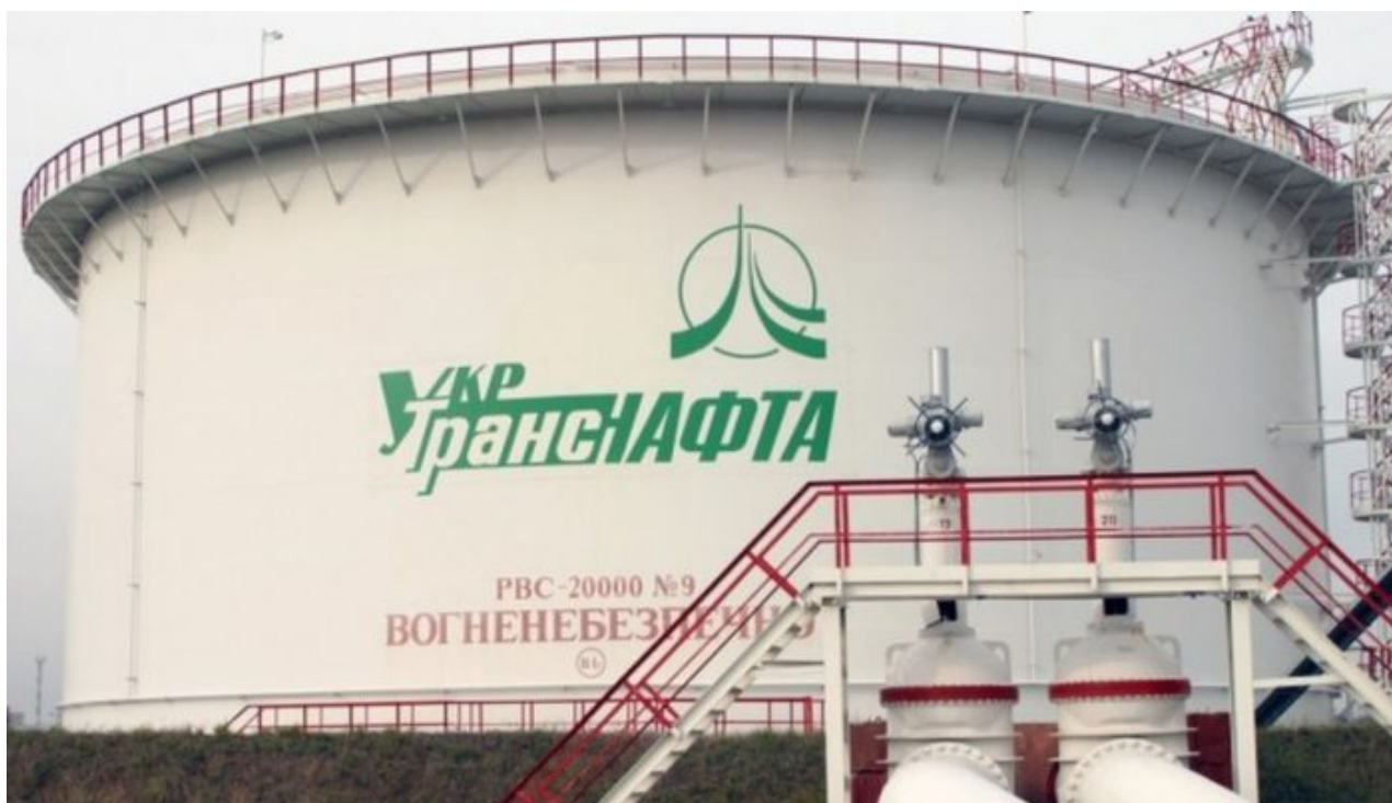
Ropný zásobník ukrajinské firmy UkrTransNafta

stranou, že platby za dodávky ruské ropy ropovodem Družba bude hradit sama, tedy ruský Transněft bude dodávat ropu do Družby, ale Ukrajině bude zálohy za použití ropovodu platit maďarský MOL, čímž se obejde ustanovení 7. sankčního balíku z Fialovy dílny, uvedl tiskový mluvčí MOL pro ruskou agenturu RIA Novosti.