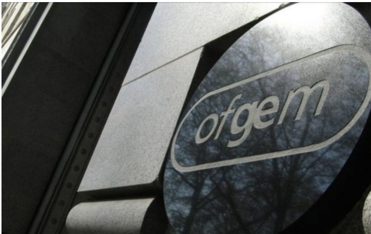
OFGEM – Britský energetický regulační úřad

Dodal: „Nikoho bych nenabádal, aby neplatil své účty, protože to jen zhoršuje situaci a má to osobní důsledky. Minulý týden britská vláda označila hnutí za „vysoce nezodpovědné. To je vysoce nezodpovědná zpráva, která nakonec jen vyžene ceny pro všechny ostatní a poškodí osobní kreditní bonitu,“ uvedl mluvčí vlády citovaný deníkem The Independent. Don't Pay UK odhaduje, že 6,3 milionu britských domácností bude tuto zimu zatlačeno do chudoby a miliony dalších pocítí stres z nekontrolovatelné inflace.