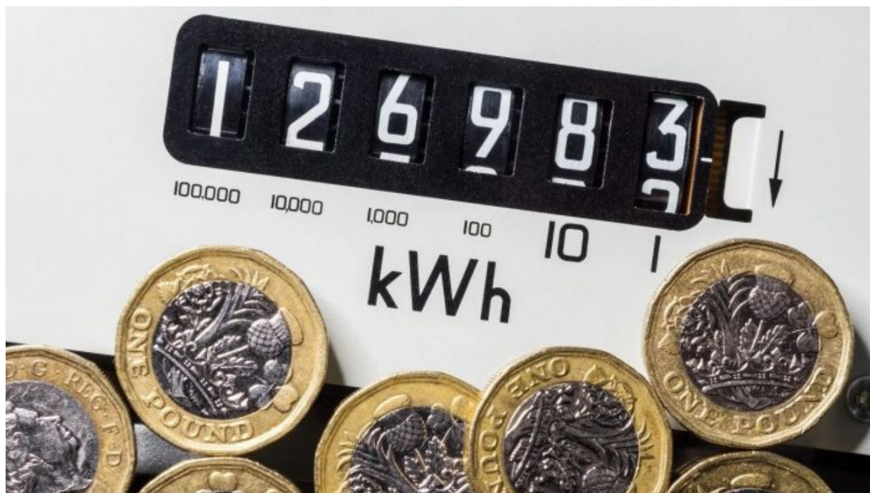
Britové se na elektřině nedoplatí

zpracování do kontaktu s elektrickým proudem, bez kterého by se potravinový produkční řetězec rozpojil a jídlo by se do vašeho žaludku nedostalo. Tak jednoduché a snadné je to konstatování. A pozor, nejde jen o elektřinu. Při produkci potravin to samé a dokonce mnohdy ještě i o něco více platí pro plyn. Plyn je totiž v produkčním řetězci výroby a přípravy potravin přítomen stejně nebo i více než elektřina. A pozor, to pořád není všechno. Ve všech potravinách je stopa po ropě.