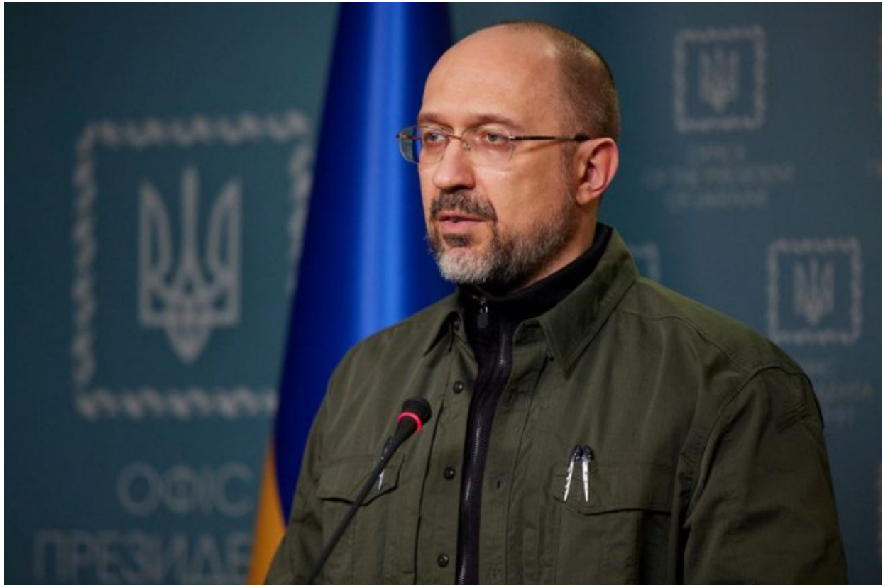
Denys Šmyhal, premiér Ukrajiny

současně je potřeba zatroubit k ústupu, aby Západ přestal Kyjevu dodávat zbraně, protože jsou ohroženy investice na Ukrajině tím, že by se Rusko mohlo zastavit až v Užhorodu a investoři z Londýna by přišli úplně o všechny investice do této války, čímž se myslí investice za posledních 10 let, které pomohly provést puč v Kyjevě v roce 2014.