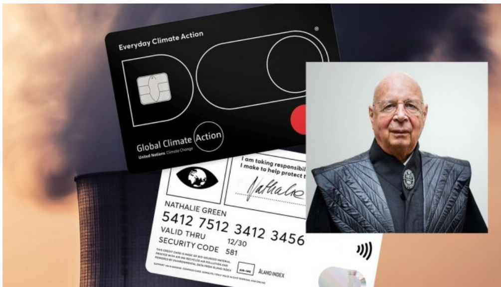
Platební karta DO švédské firmy Doconomy, kterou propagoval i Klaus Schwab

Ta technologie je zatím v začátcích, zavádí se postupně. CO 2 už vám dnes počítají donáškové společnosti na donášky jídla, jako jsou Wolt, FoodPanda a celá řada dalších. Rovněž i u nich jsou údaje o CO 2 zatím jenom informační a nemají jiný význam nebo dopad, ale to není zaručeno, že to tak zůstane napořád. Ve chvíli, kdy bude přijata tzv. osobní uhlíková daň (Personal Carbon Tax), o které mluví Klaus Schwab a rovněž Al Gore již několik let, se okamžitě všechno změní. Člověk by měl na měsíc třeba 2500 jednotek CO 2 , tedy emisní limit. A všechno, co bezhotovostně za měsíc zaplatíte, bude nést informaci o objemu CO 2 jednotek. Jakmile měsíční limit vyčerpáte, začnou se dít věci.