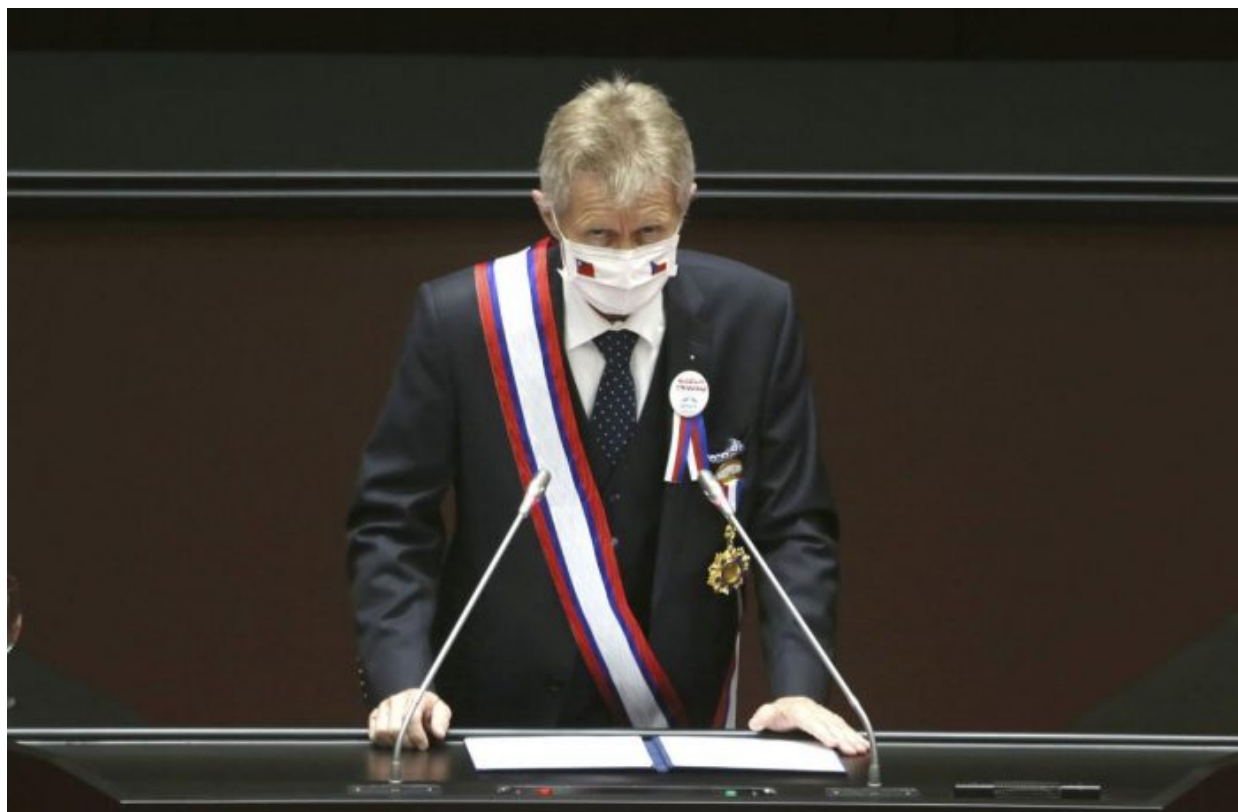
Dekorovaný Miloš Vystrčil v parlamentu v Taipei

Američané potřebují izolovat Čínu stejně jako Rusko. A chtějí na to použít stejný recept jako na Ukrajině pomocí vyprovokování jaderné velmoci k invazi proti menšímu sousednímu území. Následně se uvalí na útočníka sankce a je hotovo. Vlastně není. Je to začátek amerického odpisu Pax Americana a sjednocování Ruska, Číny, Indie a dalších zemí do nové globalizační reality, ale bez vedoucí úlohy Západu. Je naprosto jisté, že dokud je Pelosiová v Taipei, tak se nic dít nebude, ovšem Nancy Pelosi má odletět ve středu večer a poté se ukáže, v jaké pozici je vlastně čínské odhodlání k prosazování jednotné Číny. Když totiž před 2 lety navštívil Taipei šéf českého Senátu Miloš Vystrčil, byla to facka Pekingu od trpaslíka v Evropě.