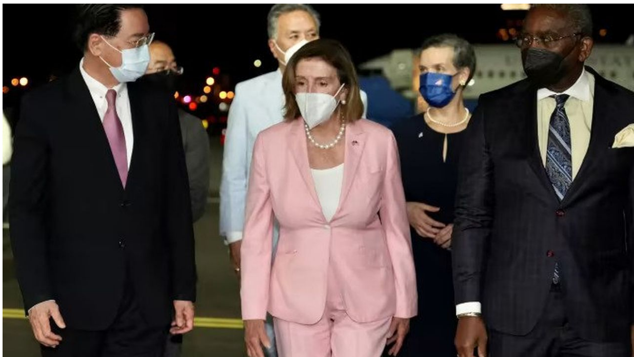
Nancy Pelosi na letišti v Taipei

Během pobytu Nancy Pelosi čínská armáda na ostrov nezaútočí, to je prakticky jisté, Američané by tím dostali záminku k vlastní invazi na ostrov kvůli ochraně Pelosiové. Jenže po odletu Pelosiové může útok čínské armády přijít de facto kdykoliv, a to zejména během onoho cvičení, které se ze cvičení promění na ostrou bojovou operaci. Večer po setmění se ve městě Xiamen rozezněly letecké poplachy, úřady poté uvedly, že šlo o neplánovanou zkoušku funkce poplašných systémů. Nebyla to náhoda, protože sirény se v noci netestují, to je nesmysl.