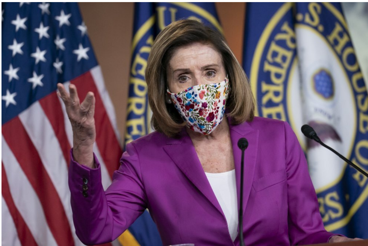
Nancy Pelosi, šéfka Kongresu USA

Uvalení sankcí na Čínu by Číně nic nezpůsobilo, Čína je manufakturou celého světa, všechno, co se vyrábí a dováží do Evropy a USA, je vyrobeno v Číně. Po uvalení sankcí na Čínu by v USA a v Evropě vypukl hladomor a akutní krize tak obrovského nedostatku zboží, že by to USA a ani EU nepřežily. Z tohoto principu ale vychází konceptuální zjištění, že Deep State vlastně nebojuje za posílení USA, ale za jeho totální rozbití. Proto v konceptuální rovině platí, že když dva dělají totéž, není to totéž. Když jeden uvaluje na druhého sankce, aby mu uškodily, ještě to neznamená, že to tak platí v případě sankcí proti Rusku nebo proti Číně. V obou případech sankcí se z toho doslova položí obyvatelstvo a domácnosti v EU a v USA.