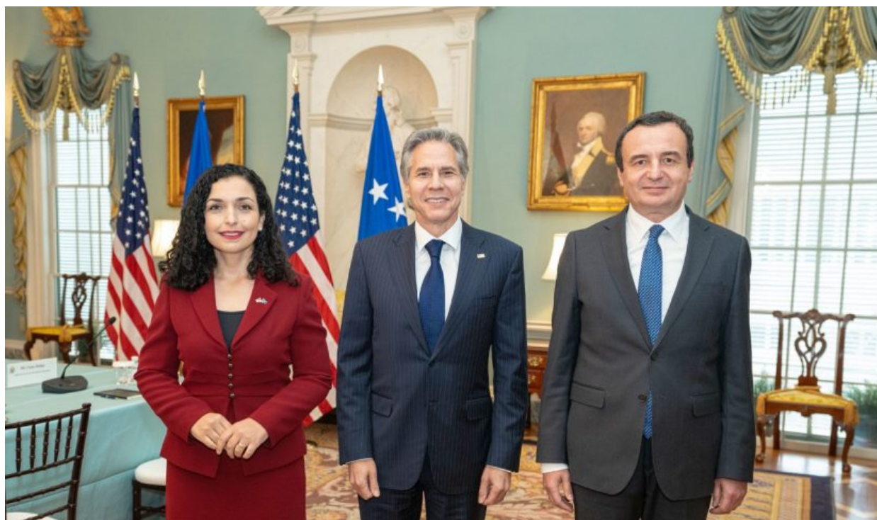
Prezidentka Kosova Vjosa Osmani, ministr zamini USA Antony Blinken a kosovský premiér Albin Kurti na schůzce 27. července 2022. Pouhé 4 dny před vypuknutím krize na severu Kosova

V posledních minutách 31. července 2022 Kurtiho vláda překvapivě oznámila [4], že “odloží” implementaci své dokumentové politiky proti Srbům na Kosovu o 1 měsíc na 1. září 2022 , a to po žádosti amerického velvyslance v Prištině Jeffreyho Hoveniera. Situace s výbušnou eskalací možné války tak není zažehnána, je pouze o měsíc odložena. Američané v čele s Blinkenem v roli šéfa diplomacie se snaží o zažehnutí již druhé války v Evropě, což by Evropu destabilizovalo ještě více. A když k tomu připočtete americkou provokaci na Taiwanu, tak zjistíte, že dementní stařík v Bílém domě, kterého teď odklidili s diagnózou covidu do ústraní, byl možná odklizen úmyslně, aby nikomu nepřekážel v rozpoutání dalších dvou válek, jedné na Balkánu a druhé na Taiwanu.