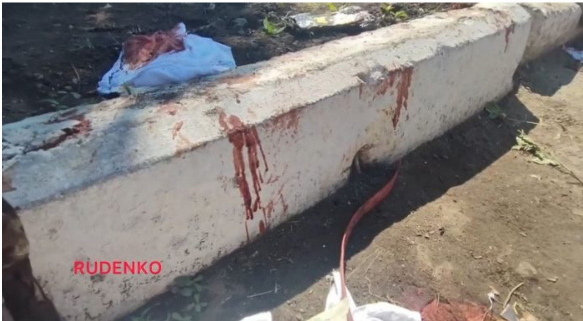
Zraněné ukrajinské zajatce ošetřovali venku na cestě

A najednou mají běžet v ofenzívě po poli proti ruským kulometným hnízdům zakopané Ruské armády nedaleko Nikolajeva. A když není ofenzíva, tak celý den tito kluci leží v zákopech a celý den na ně padají dělostřelecké granáty posílané ruskou artilérií. Je to jako ruská ruleta, protože někdy se Rusové treí a granát dopadne přesně do úzkého ukrajinského zákopu, kde leží vojáci. Celé to potom vypadá tak, že dělostřelecký granát vytvoří mohutný kráter a vyhodí do vzduchu nejen tuny zeminy, ale i roztrhaná a létající těla ukrajinských odvedenců, která se točí ve vzduchu jako efekt z hollywoodského filmu.