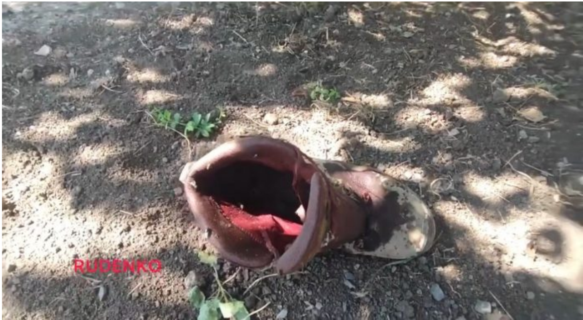
Exploze rakety utrhla jednomu ukrajinskému vojákovi nohu a bota se vyzula

Může to být útok znovu na Kyjev, o kterém si šeptají běloruská média v posledních dnech opravdu nezvykle intenzivně, může jít o operaci na Charkovskou oblast, ovšem obecně platí, že čím více zbraní Kyjev dostane, tím dále Ruská armáda dostane rozkaz postoupit. To již potvrdil [2] Sergej Lavrov.