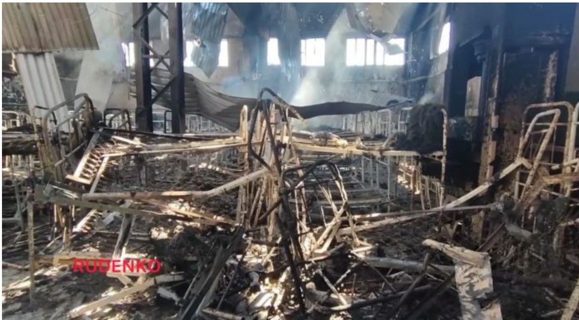
Záběry paland, na kterých spali ukrajinští zajatci

K této ochotě je potřeba u vojáka potlačit základní instinkt pudu sebezáchovy, který velí, že když někde padají bomby, rakety a střílí se, tak je třeba honem rychle utéct anebo se vzdát. A tento instinkt se musí potlačit právě opakovaným a dlouhým vojenským drillem, výcvikem, který proto trvá tak dlouho, minimálně 1 rok, někde i 2 roky, protože zbavit brance strachu ze smrti a naučit ho plnit rozkazy, které nesou rizika vlastní smrti, trvá poměrně dlouhou dobu.