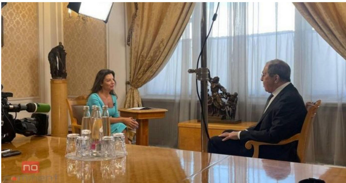
Margarita Simonjanová v rozhovoru se Sergejem Lavrovem

Je to útěk za zmenšením tzv. zlaté miliardy na menší číslo, na polovinu? Tedy na 500 milionů lidí, o kterých se psalo na Georgijských poradních kamenech, než byly minulý týden vyhozeny do povětří? Ano, je to velmi pravděpodobné. Za Evropskou komisí stojí až 60 000 lidí, což jsou globální elitáři z řad bankéřů, podnikatelů, investorů, herců, umělců, právníků, politiků, novinářů, lékařů, soudců, prostě všech, kteří představují tzv. Evropskou elitu vyvolených.