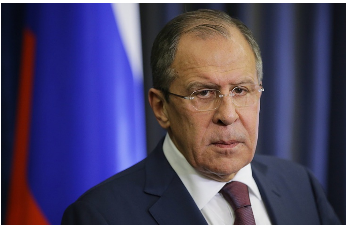
Sergej Lavrov, ministr zahraničí

Ano, tímto je oficiálně potvrzena informace Aeronetu, kterou jsme přinesli už před několika měsíci, že Rusko plánuje obsadit mnohem větší části Ukrajiny podle etnického klíče, který bude znamenat odříznutí Ukrajiny od Azovského i Černého moře a odsunutí Ukrajiny na pravý (západní) břeh Dněpru a na jihu dokonce daleko od západního břehu Dněpru. Ukrajina bude postupně své raketové komplexy odsunovat na západ, až nakonec skončí na pozicích na Západní Ukrajině, v okolí Lvova, Užhorodu a Mukačeva. A pokud i odtamtud bude ukrajinský režim pokračovat v ostřelování ruských pozic, Ukrajina bude nakonec Ruskou armádou obsazena úplně celá a Ukrajina zanikne.