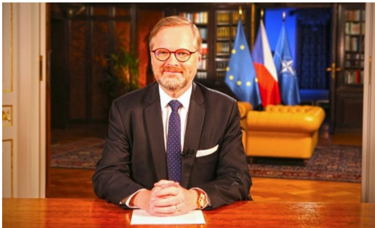
Hlavně slušně. Petr Fiala, premiér ČR

Jestli tohle není podjatost, kdy bratr v roli soudce de facto legalizuje státní blokování nepohodlných webů, které kritizuje soudcův bratr ve sněmovně a v člancích na sociálních sítích, tak to už potom vážně nevím, jaký ještě více křiklavý střet zájmů by musel existovat, aby to někomu otevřelo oči. Vláda Petra Fialy tak tímto rozsudkem dostává do ruky neuvěřitelný kanón hromadného ničení, protože teď bude moci tvrdit, že zablokování “konkrétních” webů není cenzurou, protože čtenáři si podle stanoviska soudu mohou informace přečíst i jinde na neblokovaných webech.