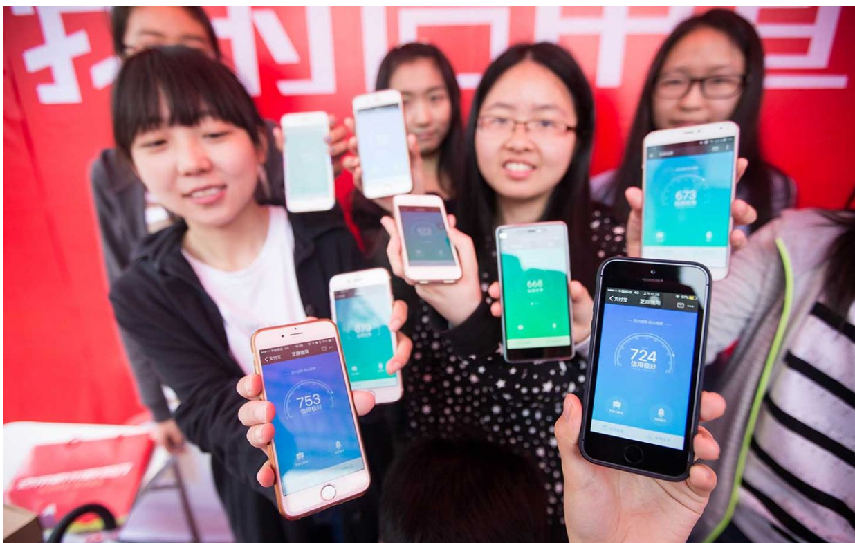
Takto již v reálu vypadá mobilní aplikace sociálního kreditu v Číně

Software provede de facto globální měnovou reformu a transformuje bankovní účty do kryptografických bezhotovostních účetních jednotek. Podle našich informací by Gideon mohl pocházet z okruhu izraelské tajné služby podobně, jako Edward Snowden uveřejnil informace z okruhu amerických tajných služeb.