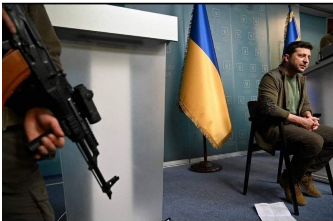
Volodymyr Zelensky v polském televizním studiu v Přemyšli během evakuace z Kyjeva

delikventy, členy gangů, mladistvé pachatele trestné činnosti, chovance z pastáček. Ti všichni byli propuštěni a evakuováni do EU. Není jasné, kolik je v ČR normálních ukrajinských dětí, a kolik dětí naopak má prokazatelně závadový původ a s ním spojené závadové chování.