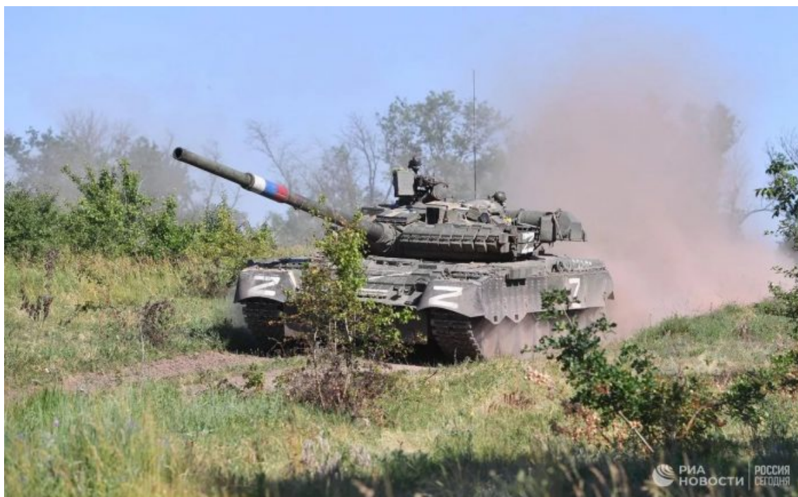
Tank T-80 Ruské armády při bojové operaci u Seversku

Ruská armáda v pondělí 18. července dobyla na Donbasu další město, tentokrát Seversk [2] a po obsazení Artěmovsku, Kramatorsku a Slavjansku bude Donbas brzy plně osvobozen, oznámila ruská média. Jenže spolu s tím se nám v Evropě rýsuje děsivá budoucnost, že uprchlí Ukrajinci v EU zůstanou natrvalo a začne proces multikulturního riftu české společnosti, který naposledy zažila za Protektorátu. Ukrajinci začnou vytlačovat Čechy z mnoha pracovních pozic, protože budou ochotni pracovat za menší peníze. Mnohem menší peníze. Klidně za minimálku. A dokonce bez doplatku bokem na ruku na minimálce.