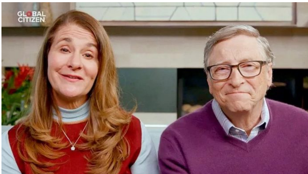
Melinda a Bill Gatesovi

Bill Gates neustále básní o tom, jak lidé budou jíst hmyz a brouky, aby došlo k redukcí emisí CO 2 a dusíku na této planetě, abychom se neudusili. Jeho přítel Klaus Schwab ze Světového ekonomického fóra pro změnu tvrdí, že ve světě po Velkém resetu nebudete nic vlastnit a budete šťastní. A přesně tak to nyní má proběhnout v Holandsku.