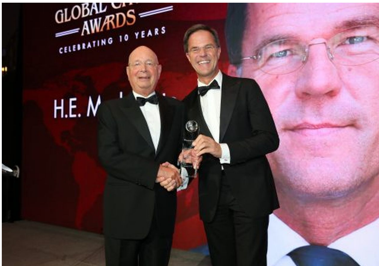
Klaus Schwab předal Marku Ruttemu ocenění "Globální občan" na slavnostním večeru The Atlantic Council

Jednou z největších svobod je pěstování potravin vlastními silami na vlastní půdě vlastními prostředky. Toto je právo, které je jedno z nejstarších práv na této planetě. Dokonce i otroci v otrokářských systémech měli právo si vlastními silami pěstovat jídlo a chovat zvířata ke své obživě, viz. otroci na americkém jihu v USA v polovině 19. století. Jenže dnes už nemáte toto právo ani jako svobodní lidé, ani jako otroci.