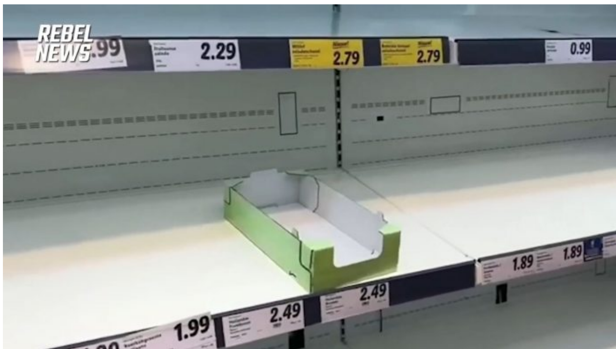
Prázdné regály v holandském supermarketu

A víte, že tuto svobodu v minulých 2 letech už globalisté lidem vzali. Už si o svých tělech nerozhodují. Dalším atributem svobody je svoboda volby stylu života a životosprávy. Svobodně si volíte, co jíte, konzumujete, pijete, jak často a v jaké struktuře. Ani tuto svobodu již nemáme mít, globalisté nám chtějí nařizovat, co máme jíst, a co naopak už se nesmí jíst, protože to škodí přírodě a představuje to prý terorismus proti planetě.