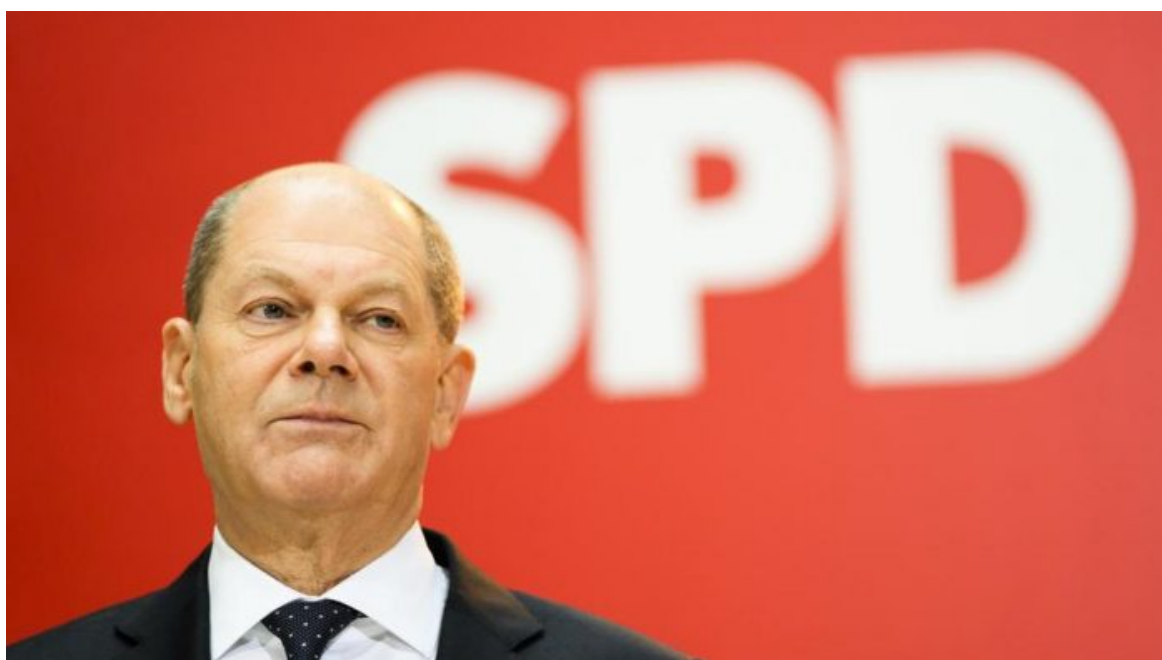
Olaf Scholz, německý kancléř a šéf SPD

Anebo pokud si nepamatují na průběh noci. Skandál podle německého bulváru propukl údajně tak, že jedna z poslankyň, jejíž jméno policie nezveřejnila, si doma ráno všimla, že má na sobě cizí kalhotky a cizí podprsenku o dvě čísla větší, zatímco kalhotky jí byly těsné. Někdo ženu zdrogoval, svlékl a když ji znovu oblékal, pomíchal oblečení, protože takto zneužitých a svlečených žen bylo asi pospolu více a došlo k záměně oblečení.