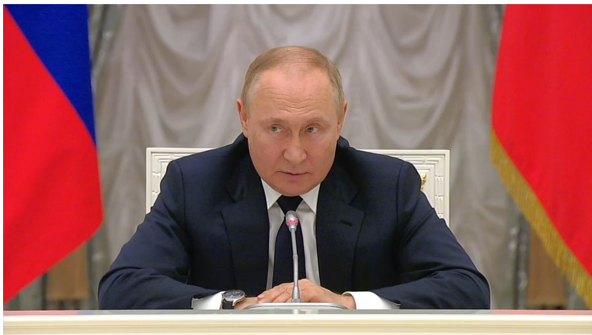
Vladimir Putin, ruský prezident

Globální prediktor totiž začal provádět neuvěřitelné pořádky a doslova masakr motorovou pilou, který Evropa za celé dekády nepamatuje. Již dopředu jsem na to upozorňoval, že Henry Kissinger na povel Komise odstartoval proces, který postupně začne v celé Evropě odstraňovat od moci všechny politiky, kteří jsou nebo donedávna byli vazaly a poslušnými loutkami amerických elit a tzv. elitářů Pax Americana.