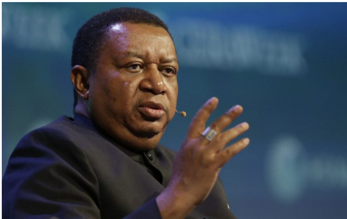
Mohammad Barkindo, šéf OPEC (+63)

A to doslova jen pár hodin poté, co ve svém posledním projevu vyzval [4] USA a kolektivní Západ, aby zrušil sankce na export íránské a venezuelské ropy, aby mohlo dojít k ulehčení ropné krize v Evropě , kde spotřebitelé čelí likvidačním cenám. A to byl podle všeho rozsudek smrti. O několik hodin později byl Mohammad Barkindo nalezen mrtev. Podle neověřených zpráv z Nigérie byla příčinou smrti prý akutní hypoglykemie, tedy smrt způsobená prudkým poklesem cukru v krvi, což vyvolá tzv. hypoglykemický šok a dochází k bezvědomí a k rychlému selhání činnosti jater, sleziny, srdce a plic.