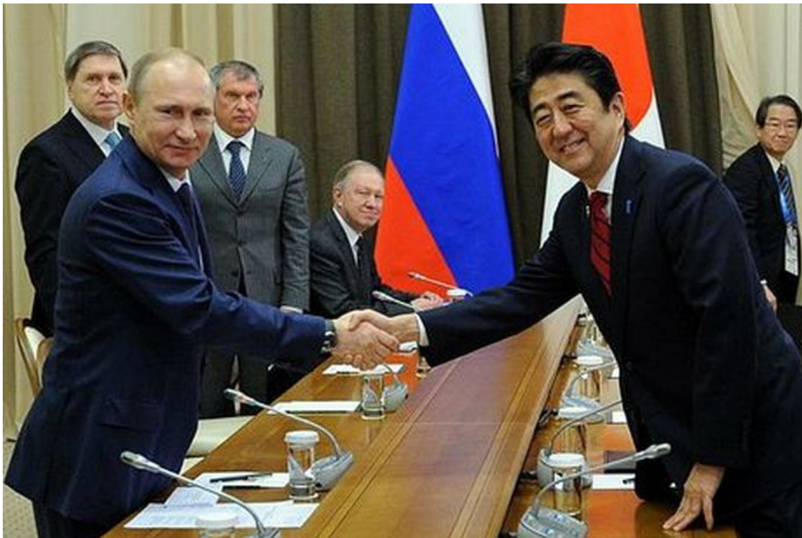
Vladimir Putin a Abe Shinzo při neúspěšných jednáních o Kurilských ostrovech v roce 2016. V té době již Kreml věděl o plánech na výstavbu americké raketové základny na Okinawě

V roce 2020 Shinzo požádal [2] vládu Donalda Trumpa, aby v Japonsku posílila americká vojska svoji přítomnost a počet vojáků, kvůli vzrůstající dominanci Číny v regionu. Pokud by se Abe Shinzo znovu dostal po volbách k moci, Japonsko by ostře změnilo kurz a přešlo do protiruské, protičínské a na druhé straně silně pro-americké politické linie. Tohle nemohl globální prediktor už tolerovat a riskovat. Abe Shinzo už ale kandidovat nebude, je po smrti. Abe Shinzo se v posledních letech své vlády snažil poměrně dlouho navazovat lepší vztahy s Ruskem ve snaze otevřít otázku Kurilských ostrovů.