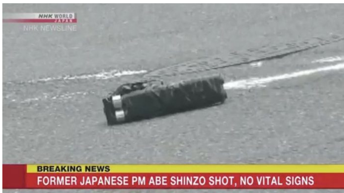
Improvizovaná brokovnice, kterou byl Abe Shinzo zastřelen

americkou vládu v Bulharsku. Včera přišli o Borise Johnsona ve Velké Británii. Dnes přišli o věrného přítele Abe Shinza. Právě jsme svědky odepisování USA v přímém přenosu a americký národní prediktor se nehodlá jen dívat.