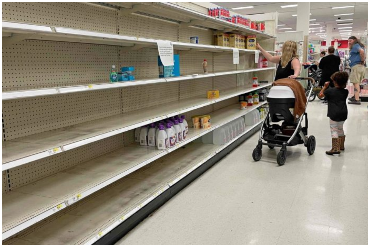
Prázdné regály v obchodech v USA s dětskou výživou

amerických sankcí na Rusko se hrouť, potom se hrouť i americké domácnosti , americké regály v obchodech jsou prázdné, není ani Sunar pro děti, ani hygienické vložky.