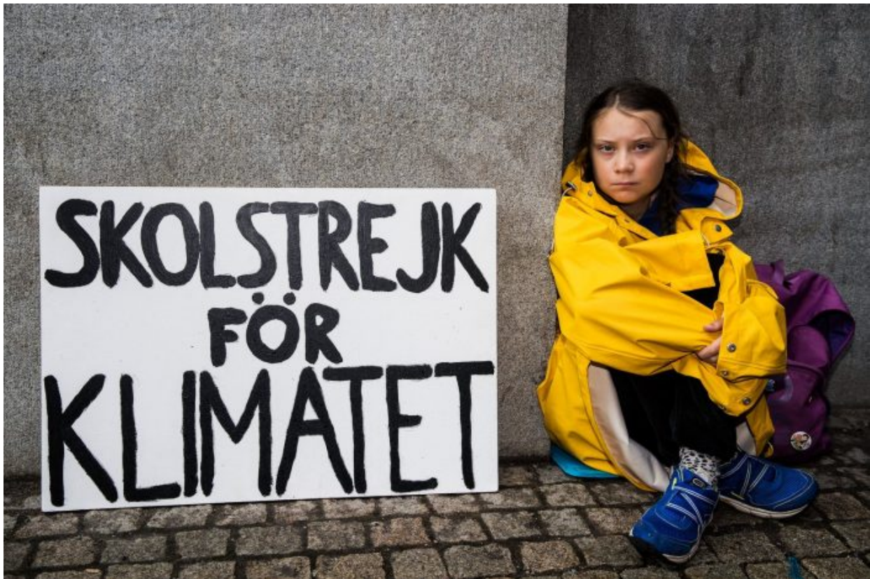
Greta: Operace globalistů na odstavení světa od potřeby ropy, a tím pádem od petrodolaru

Globalisté totiž k odchodu od ropného automobilismu k elektríně potřebují poměrně dlouhé přechodné období. Bude potřeba vybudovat obnovitelné zdroje energie, hodně zdrojů, a to bude trvat dlouhá a dlouhá léta. To přechodné období v Evropě měl energeticky vykrývat laciný ruský plyn, protože na světě nic lacinějšího než ruský plyn nenajdete.