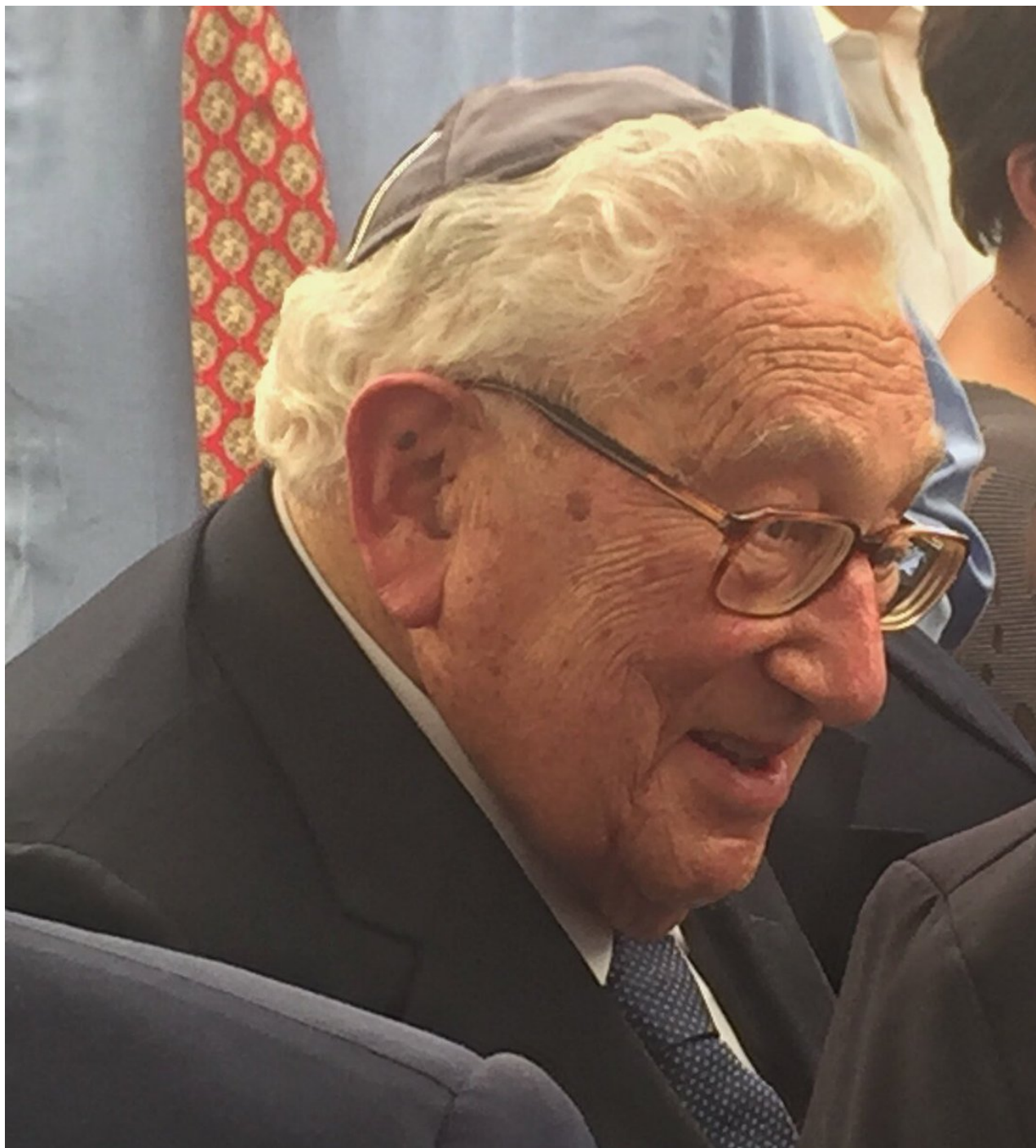
Henry Kissinger (Avraham ben Alazar).

Independent Order B'nai B'rith (Synové smlouvy) byl založen v New Yorku 1843 východními Židy (Aškenázy) na pokyn Rothschildů. Podnětem jeho vzniku bylo rozrušení světové veřejnosti ze židovské rituální vraždy v Damašku (1840). Je to výhradně židovský zednářský řád, jemuž jsou v podstatě podřízeny všechny zednářské lóže na světě. Nejvyšší vedení zednářstva je právě zde. Řád provádí světovou židovskou politiku ve velkém stylu – rozpoutal bolševické revoluce v Rusku v letech 1905 a 1917, revoluce v Německu a Maďarsku v roce 1918 a 1919, I. a II. světovou válku, a dále pak 2 638 revolucí a převratů v celém světě. Jeho finanční oporou je Rothschildova bankovní říše. Jeho členy byli resp. jsou K. Eisner (Salomon Kosmanowski), E. Toller, E. Mühsam, K. Radek (Sobelsohn), M. Leviné, B. Kun (Aron Kohn), K. Liebknecht, A. Kerenskij (Kirbis), P. Helphand, L. Trockij