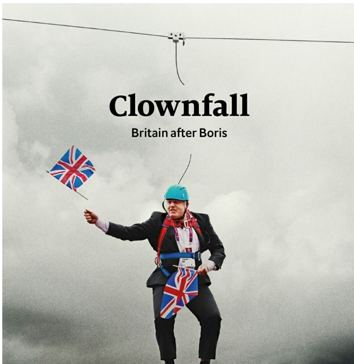
Pád klauna. Fotografie z titulní strany časopisu The Economist

Stačila pouze dvě vystoupení Henryho Kissingera před měsícem a začínají se dít změny, které Evropa nepamatuje. Britský premiér Boris Johnson po vzpouře více jak 50 členů vlastního kabinetu dospěl k rozhodnutí, že bude rezignovat na funkci předsedy Konzervativní strany a rovněž na funkci ministerského předsedy. Největší válečný jestřáb v Evropě a největší podporovatel Ukrajiny a války na Ukrajině padl a v Kyjevě je zle, protože se jedná o signál počátku konce podpory Evropy válečnému úsilí Kyjeva.