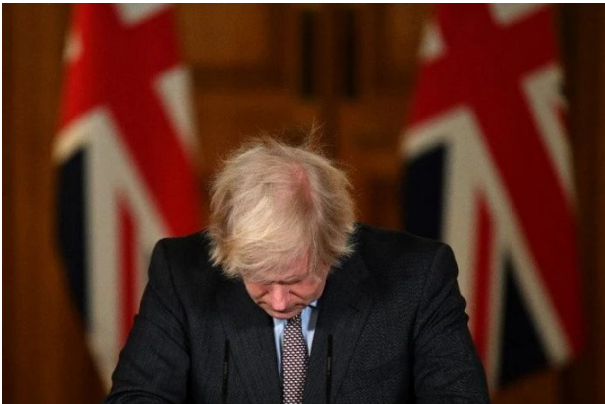
Poražený Boris Johnson po palácovém puči

Globalisté se rovněž rozhodli, že se zbaví současné slovenské vlády. O tom je již podle všeho rozhodnuto. Hnutí SaS Richarda Sulíka vypovědělo [2] koaliční smlouvu a dokonce prázdnin musí koalice přijít s novou koaliční smlouvou, přičemž SaS si klade podmínku, že v nové vládě již nesmí figurovat šéf Hnutí OLANO Igor Matovič, který je dnes ve funkci ministra financí. Podle Richarda Sulíka si Matovič ze státní pokladny udělal kasičku pro soukromé projekty.