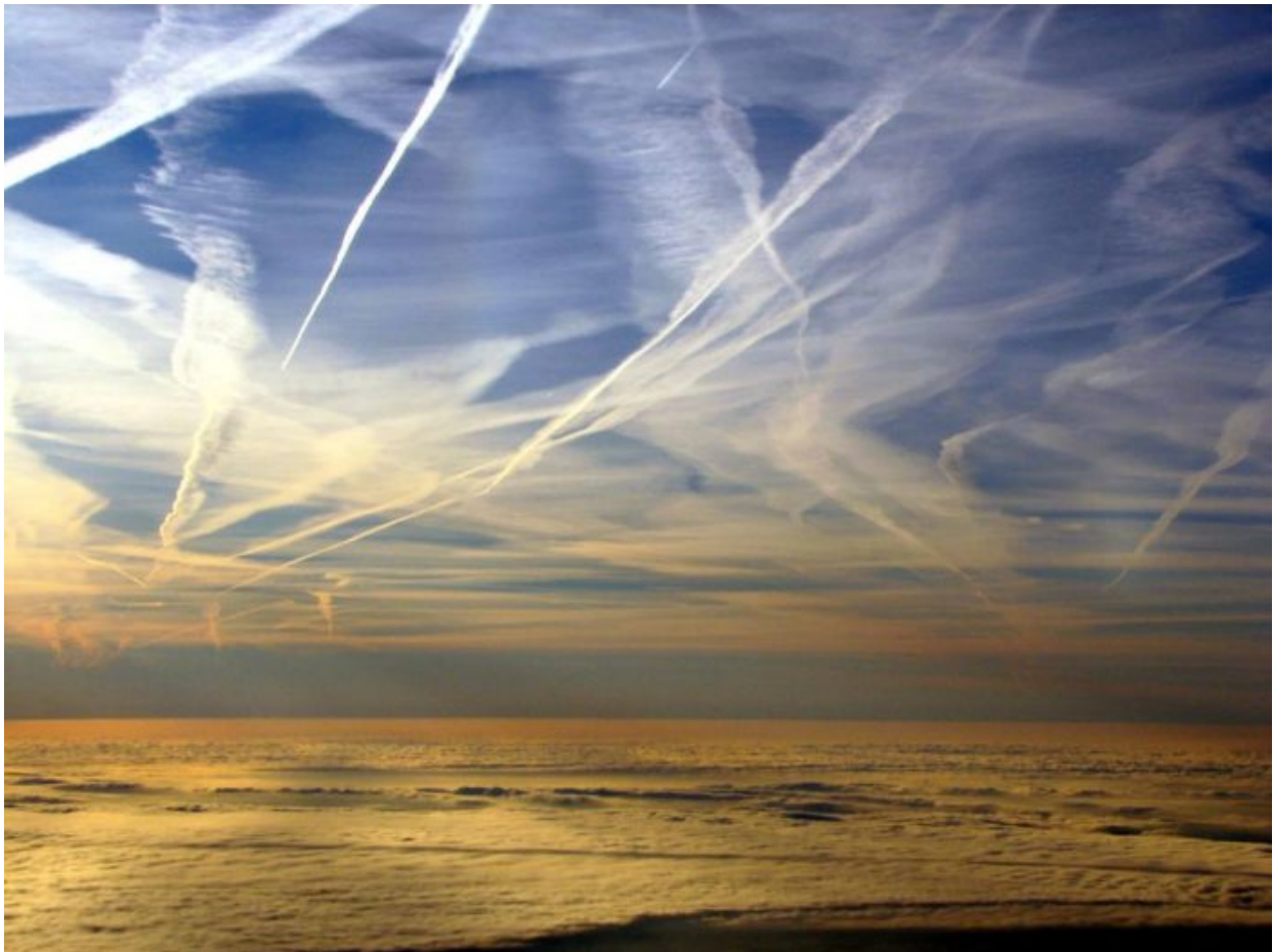
Chemtrails, jenom chemtrails, žádné mraky, jenom chemka po celé obloze. Ilustrační foto

Všechny ty částice kovů a oxidů rozprášených v atmosféře se musí prostě nějak projevit na změně klimatu a bouřky jsou právě jedním z hlavních cílů těchto geoinženýrských projektů globalistů na kontrolu klimatu. Nejprve sucha a potom průtrže mračen způsobující záplavy, ale hlavně něco daleko horšího. Víte, co je ještě horší než sucha a záplavy? Odplavování orné půdy z polí do řek! To je ten skutečný cíl globalistů! Indukce nedostatku potravin, indukce hladomoru! Ještě vám to nedochází?