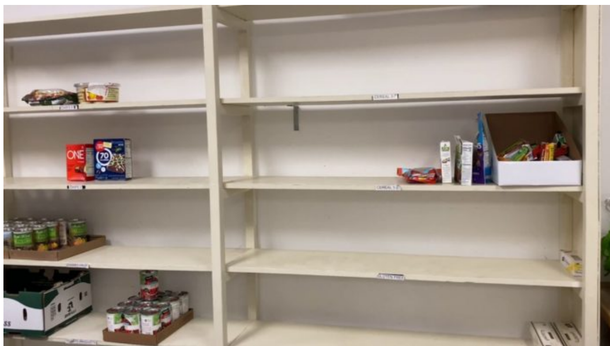
Takhle to už vypadá dnes v britských obchodech

roce 1989 úplně vybila. Český gój nesmí být soběstačný! Tak bylo rozhodnuto po 17. listopadu! Dnes se do ČR dováží více než dvě třetiny surového nezpracovaného masa právě z ciziny.