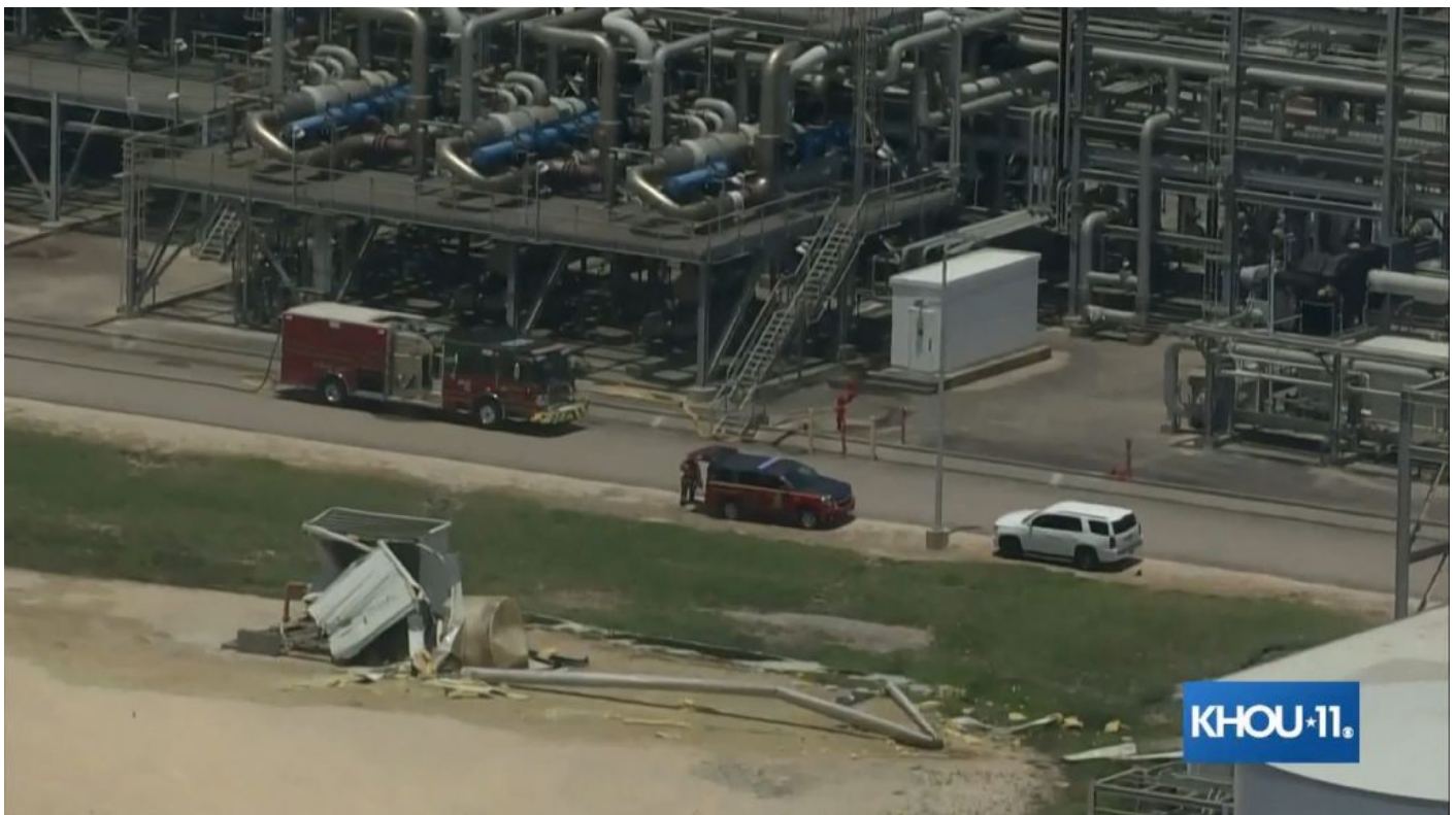
Pokroucená skříňka. Kvůli tomuhle nesmyslu prý bude terminál 3 týdny mimo provoz. Tak určitě...

Pokud chcete vidět, jak vypadá exploze na plynovém terminálu doopravdy, prohlédněte si fotografie z následků výbuchu terminálu v Mexiku v září 2012 [1]. Anebo exploze terminálu v Norfolku v roce 2008 [2]. Anebo exploze terminálu v Číně v roce 2015 [3]. A potom to porovnejte se záběry z helikoptéry nahoře. Myslím, že to nepotřebuje komentář.