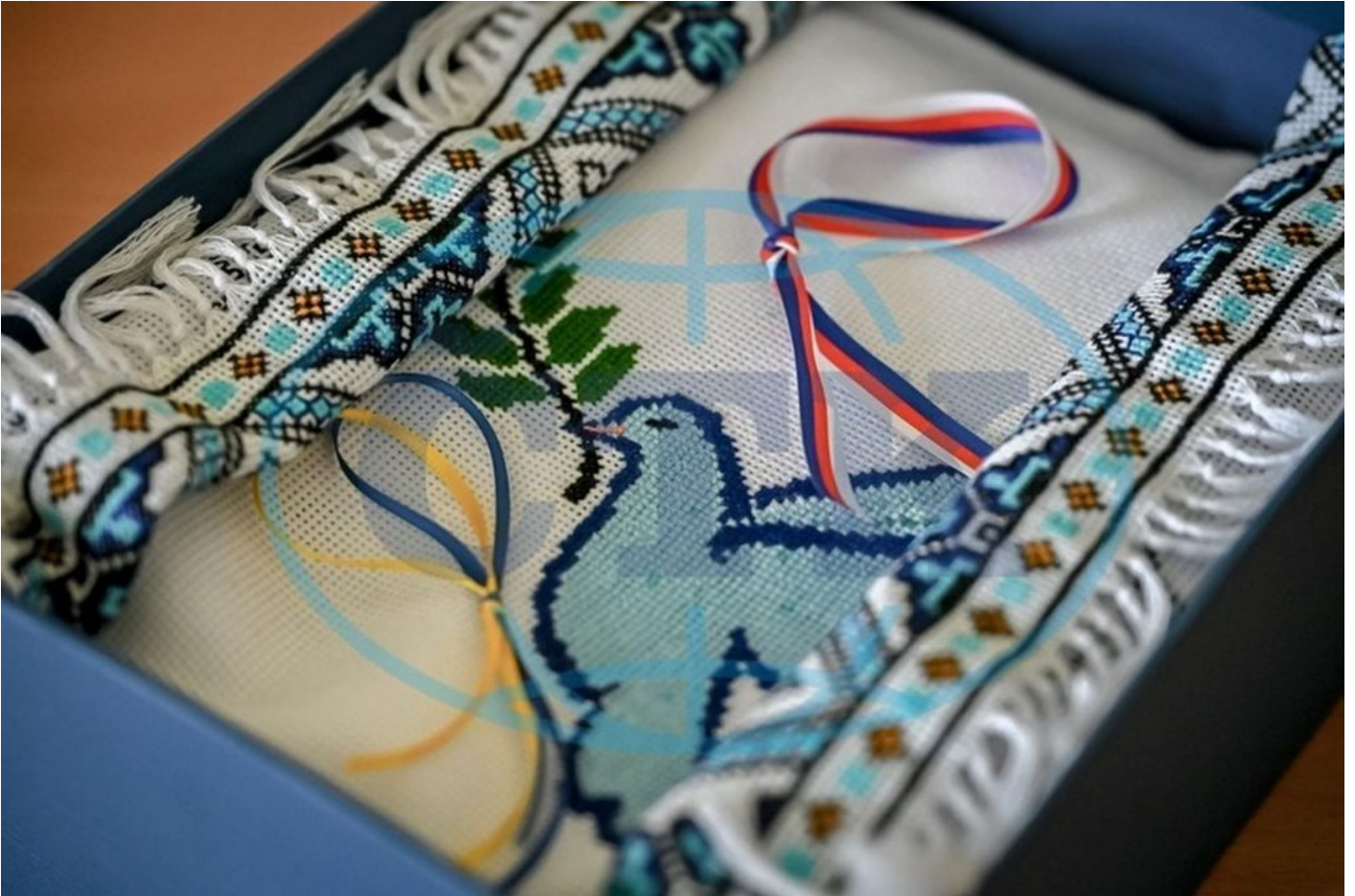
Ukrajinská šála, kterou předal Petr Fiala papežovi

Ten totiž namísto toho, aby řešil horentní zdražování, inflaci a propad českých rodin do likvidační chudoby, jezdí po světě a staví se do role politika, u kterého začínáte mít pochyby, jestli je pořád ještě českým premiérem, anebo už převzal úřad na Ukrajině. Petr Fiala totiž přijel do Vatikánu na schůzku s papežem a jako dar mu přivezl [4] kromě Bible i ukrajinskou šálu! Ano, čtete správně! V krabičce se šálou ale byly navíc dvě stužky. Malá česká, ale vedle ní opět ukrajinská! To prostě vypadá už jako kdyby Ukrajina byla součástí ČR.