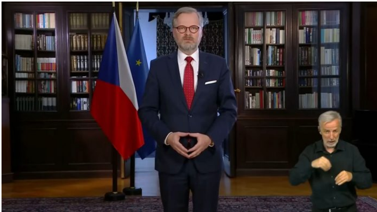
Okultní symbol “vidoucího oka”

Během tohoto vstoupení Petr Fiala gestikuloval rukama a mnohokrát vyslal svými rukama okultní symbol vidoucího oka. Je to tentýž symbol sepjatých prstů, který používala Angela Merkel. Tento okultní symbol vyjadřuje nejvyšší proces řízení na této planetě, oko prediktora, vidoucí oko, oko žrečstva, oko osvícených, oko illuminati.