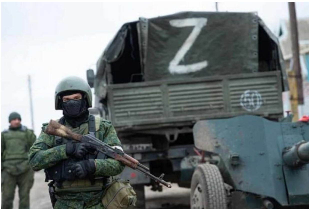
Operace Ruské armády na Donbasu

A jak se zdá, konec války na Ukrajině už začíná docházet i novinářům v Evropě a konkrétně v Německu. Bavorský list Süddeutsche Zeitung dnes přinesl článek [1] s nadpisem, že Šance Ukrajiny vyhrát tuto válku se blíží nule a v textu redakce narovinu uvádí, že... jatka na Ukrajině skončí pravděpodobně až ve chvíli, kdy jeden ze dvou protivníků doslova vykrvácí. V současné době to nebude Rusko.