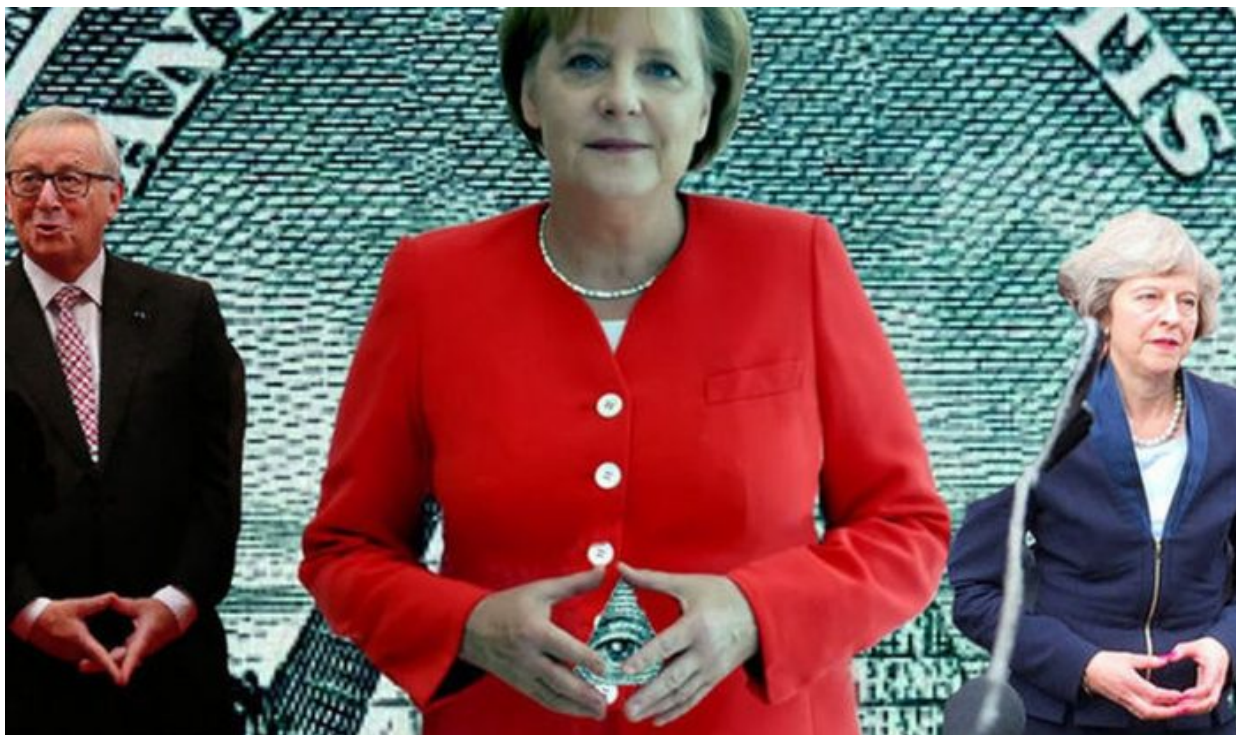
Jean-Claude Juncker, Angela Merkel a Theresa May se symboly vidoucího oka

To samé totiž prováděla s plným vědomím Angela Merkel spolu s dalšími vrcholovými politiky v Evropě, a proto zobrazovala symbol, že slouží globalistickému prediktorovi. Ten symbol lze chápat jako obranu. Politik tím dává najevo, že “ pouze ” slouží globálnímu prediktorovi v jeho procesech. Stejně jako Angela vedla Německo do pekel v zájmu odpisu USA v Evropě, to samé nyní provádí Petr Fiala. Ten odpis probíhá tím jediným možným způsobem, skrze peněženky a nákupní vozíky goyim , což je jediný způsob, jak odepsat USA v Evropě.