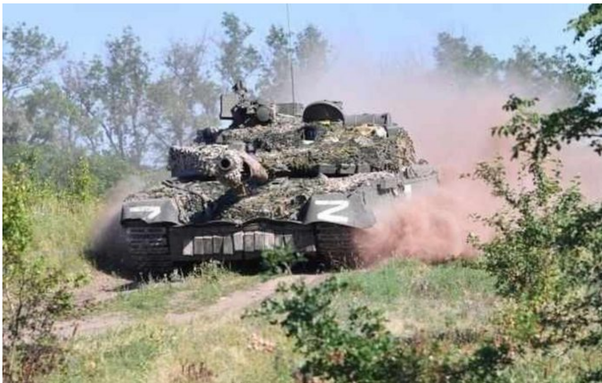
Zamaskovaný ruský tank T-90

Přesně takhle to bylo na Ukrajině. Ukrajinská armáda nejprve nasadila profesionální vojáky. Ti padli a skončili již v první polovině března, kdy Rusové pozabíjeli přes 70 000 ukrajinských vojáků. Ihned poté začal generální štáb povolávat vojenské posily ze zbytku Ukrajiny. Již koncem března povolal Zelenský ukrajinské záložníky, ale dostavila se jen malá část. Zelenský proto vyhlásil mobilizaci a začal povolávat jednotlivé ročníky, což skončilo minulý týden tím, že armáda pověřila ministerstvo školství, aby vytipovalo studenty 3. a 4. ročníků středních škol, které by bylo možné odvést na frontu.