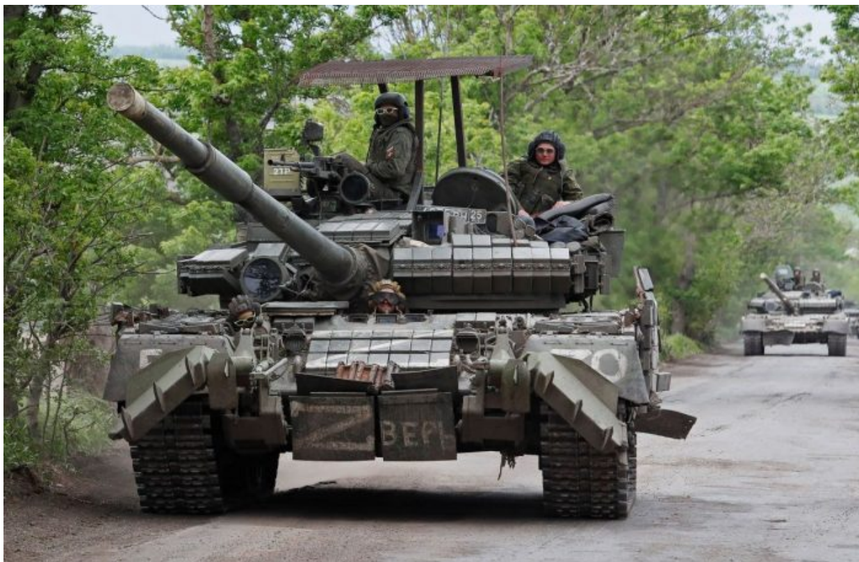
Kolona ruských tanků mířících k Severodoněcku

Americký senátor se rovněž pozastavil nad tím, že Ukrajina denně přichází o 1 000 mužů denně, z toho 200 jich zemře a zbytek je zajat, přičemž za celý měsíc zemře na 6 000 ukrajinských vojáků. To je 12x více obětí, než kolik měla americká armáda ve Vietnamu a tyto ztráty nemůže Ukrajina podle Blacka prostě ustát. Rovněž se neustále objevují dezinformace o tom, že Kreml prý chystá v Rusku mobilizaci.