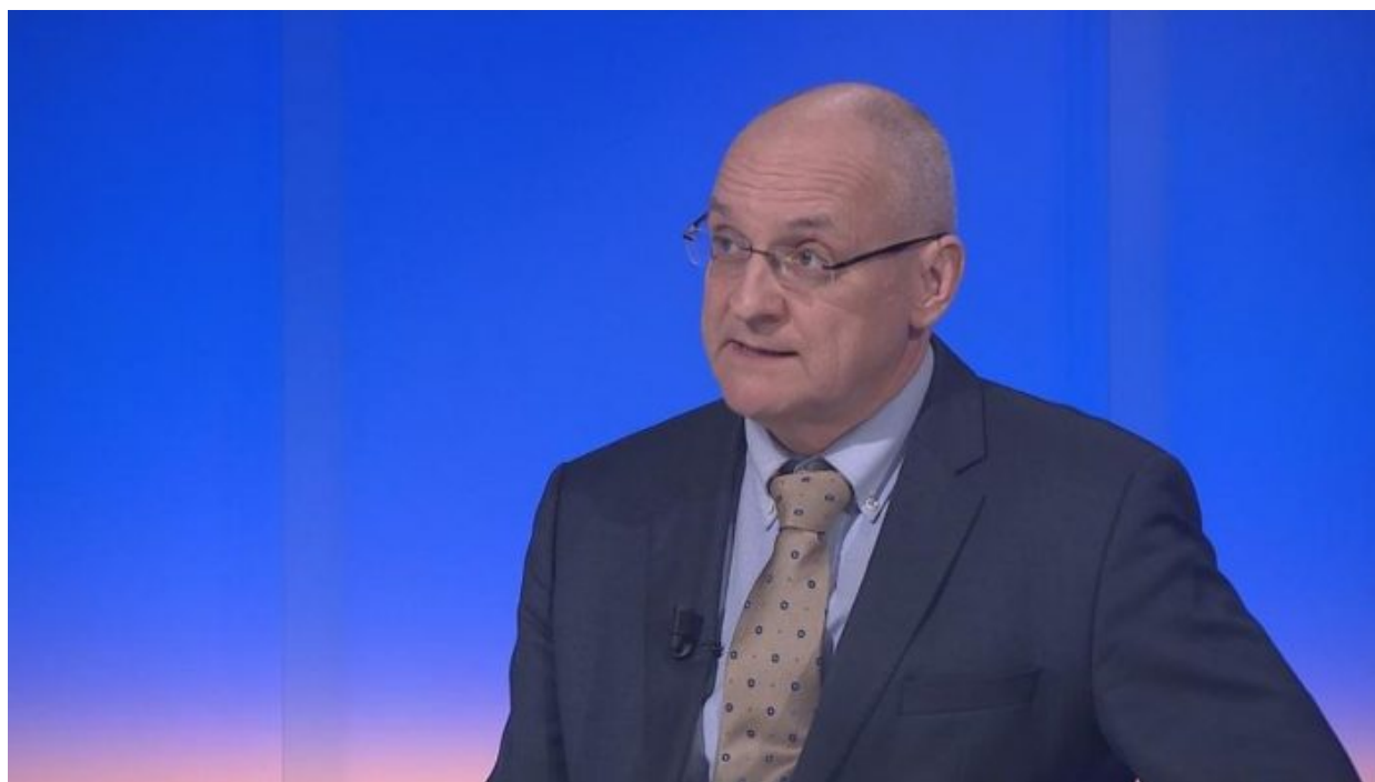
Václav Bartuška, zvláštní velvyslanec ČR v EU pro energetiku

Bartuška pro zmíněný server doslova uvedl: “... model, který byl použit na východě Ukrajiny, v Doněcku, Luhansku a v dalších městech. Šlo to jakoby přes kopírák a popírá to teorii o lidovém povstání. Skupina civilistů obsadí budovy administrativy, muži, ženy, děti. Do dvou dnů se tam začínají nosit zbraně, ženy a děti odcházejí, zůstávají ozbrojenci. Pokud se jim postavíte rychle čelem, jako to udělali třeba v Oděse, kde je prostě upálili, nebo v Dněpropetrovsku, kde je prostě zabili a pohřbili u silnice, tak máte klid. Když to neuděláte, tak máte válku.”