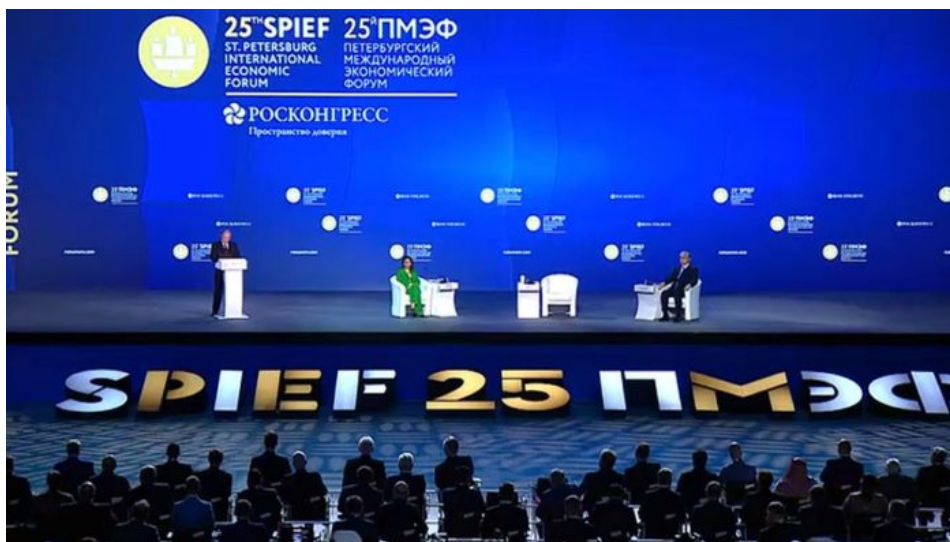
Diskusní panel SPIEF 2022

Další mohutnou náloží byla Putinova zmínka o tzv. Dechu doby , což je ruský koncept a obdoba německého hegelovského konceptu Zeitgeist , tedy ducha času, který nutí lidstvo neustále a pořád dokola opakovat svoji historii, dokud se lidstvo ze svých chyb nepoučí. Ruský koncept Dechu času, resp. doby je v podstatě identický, je to koncept převzatý od Hegela do ruské literatury a lehce poupravený ve smyslu vdechnutí nových myšlenek člověku s příchodem Nového času, resp. řádu . A právě o Novém času Vladimir Putin dále hovořil. Doslova mluvil o tom, že právě teď se ukotvuje Nový světový řád a hroutí se unipolární ukotvení světové moci, v jejímž čele stály USA.