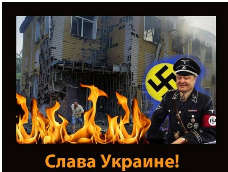
Bývalý prezident Ukrajiny Petro Porošenko vedl celkem 2 válečná tažení proti obyvatelům Donbasu

Když se to hodilo v případě Kosova v roce 2008, byl tento článek použit. Kosovo se na základě Charty OSN odtrhlo od Srbska. Když ale totéž o 6 let později udělali obyvatelé Krymu a dvou provincií na východě Ukrajiny a odtrhli se od Kyjeva, byl z toho skandál, západní sankce na Rusko a dvě válečná tažení ukrajinské armády proti vlastním obyvatelům na Donbasu.