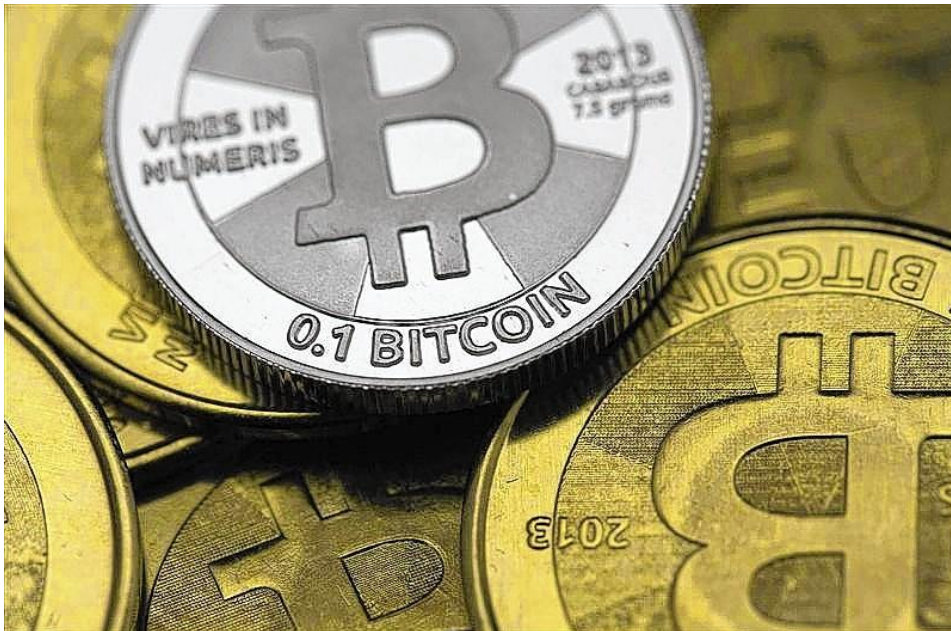
Globalistický Proof of Concept nové měny kryté elektrickým výkonem namísto ropou

Bude se to rovnat podkladu aktiva zlatem. Dokonce více než zlatem. Zlatem si totiž napřímo nezatopíte, nerozsvítíte, nedojedete z bodu A do bodu B za jednotku času, která je mnohonásobně kratší, než je doba lidské chůze, jízda na kole nebo koloběžce. Všechno, co teď okolo sebe vidíte, je přechod všeho okolo nás z různých fosilních paliv mnoha druhů, jako je ropa, plyn, uhlí nebo uran na jeden jediný koncový zdroj energie, na elektřinu.