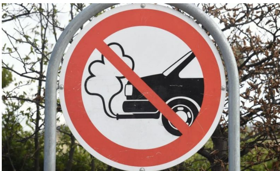
Podobné značky se brzy začnou objevovat po celé Evropě na mnoha místech

Lidé se budou pohybovat a přesunovat hromadnou dopravou. Osobní přeprava prakticky zanikne a bude dostupná jen pro nejbohatší lidi a pro elity. Namísto aut se lidé po městě, v létě i v zimě a mrazech budou přesouvat na koloběžkách jako v bizarním sci-fi filmu, přičemž na delší trasy se budou používat kola klasická na šlapání, protože dobíjení koloběžek bude finančně velmi drahé. Na opravdu dlouhé trasy se bude cestovat elektrickými vlaky. Naftová autobusová doprava skončí a budou se používat elektrické autobusy.