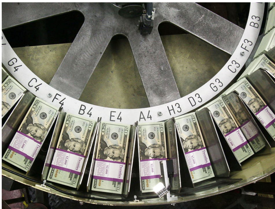
Rotary tiskárna FEDu na dolary. Podobnost s logem Rotary klubu není náhodná

Elektřina se vyrábí v jednom čase, v jednom objemu a ihned se spotřebovává. Neexistuje efektivní schovávání a uskladňování na horší časy. Elektřina tedy definuje elektrický příkon v daném čase, který dokáže vytvořit dané hodnoty v průmyslu, v dopravě a ve službách. Když není dodána elektřina, hodnoty se nevytvoří. Co to znamená? No přece, to je definice měny! Podkladového aktiva!