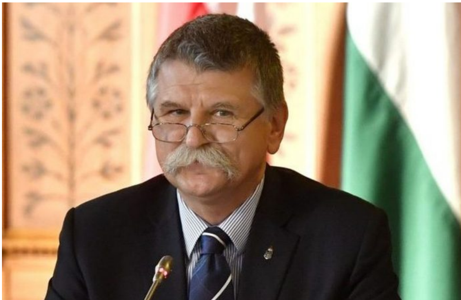
Předseda maďarského parlamentu László Kövér

Není proto divu, že podle běloruské tajné služby, jak uvedl o víkendu běloruský prezident Alexander Lukašenko, vznikl v generálním štábu ukrajinské armády odpor proti dalšímu setrvání Zelenského ve funkci prezidenta, protože generálové se bojí, že jako drogově závislá osoba přenechá Polsku západní část Ukrajiny. Generálům se nelíbí [4], že Zelenský udělil polským občanům trvalé pobyty na území Ukrajiny v zrcadlovém modelu, jaký přijalo Polsko pro ukrajinské občany.