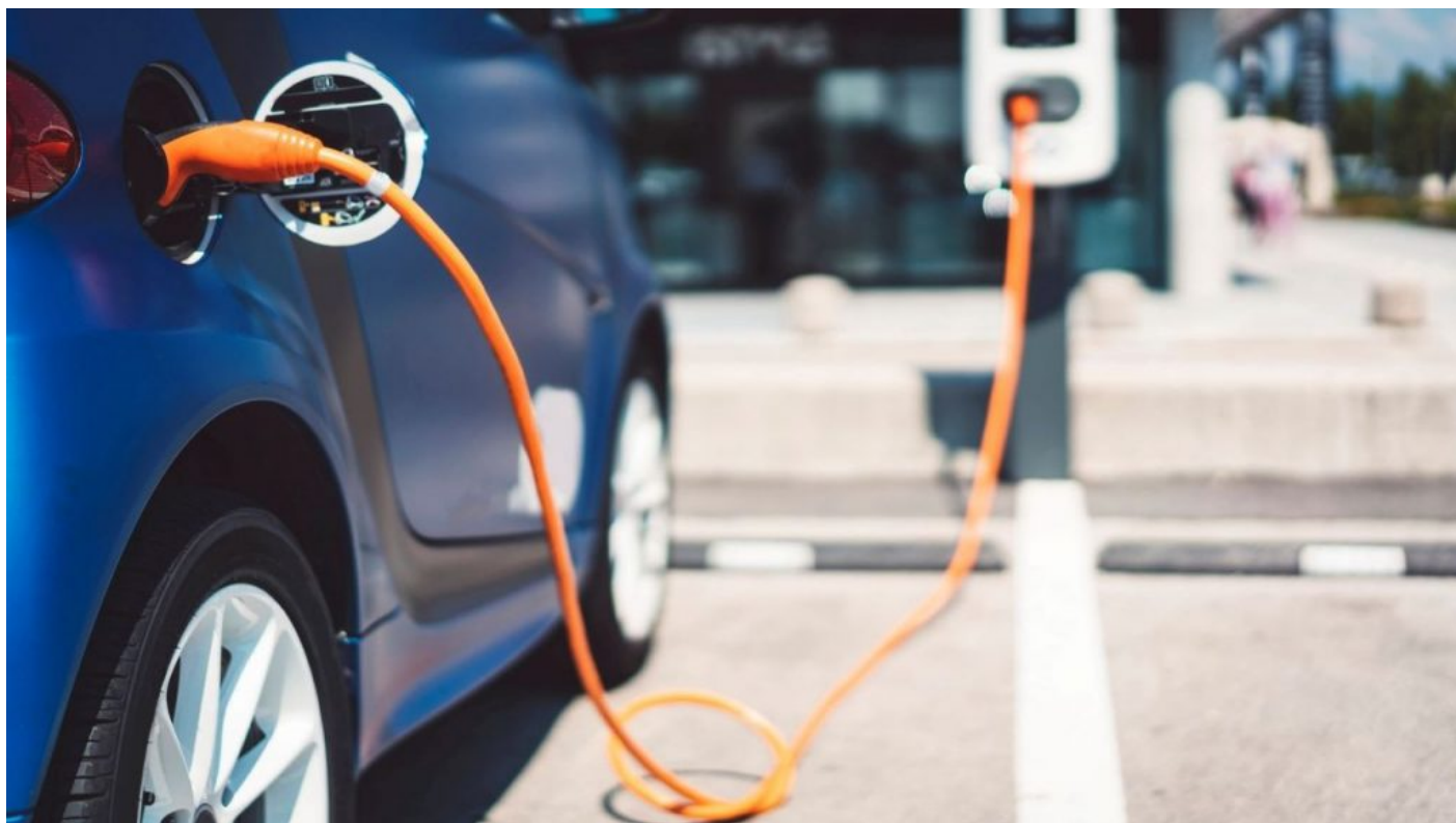
Tohle chtějí globalisté získat z krize na Ukrajině. Nabíjení elektrických vysavačů na 4 kolech pomocí šňůr z nabíječek

Ten totiž po 7 letech můžete vyhodit, protože výměna bateriového setu vyjde na více peněz, než je zůstatková hodnota samotného ojetého elektrického auta. A to nemluvím o nepoužitelnosti elektrických aut na delší trasy, pokud tedy nemáte dopředu sjednanou a rezervovanou nabíječku na trase. A nezapomínejte na 40% snížený dojezd v průměru v zimních měsících.