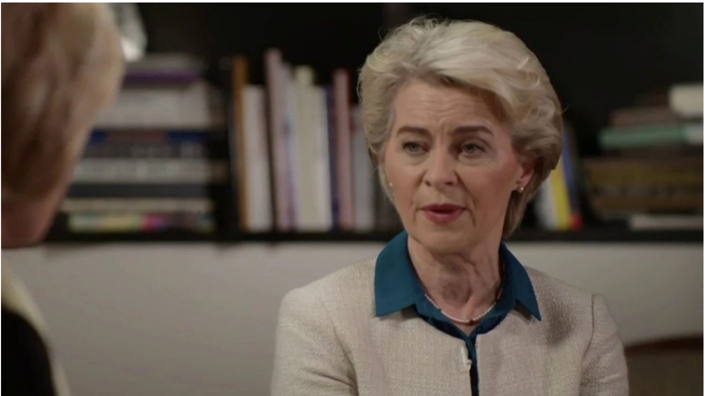
Ursula von der Leyen na americké televizi MSNBC

Možná jste zaregistrovali v poslední době neschopnost Evropské komise a Rady dohodnout se na tzv. 6. balíčku sankcí proti Rusku, kterému se jinak říká Embargo balíček, protože má spočívat v zákazu dovozu 3 ruských surovin do EU, konkrétně ropy, plynu a uhlí, přičemž se mluví i o ruském jaderném palivu pro elektrárny jako o 4. typu energií. Jenže evropské země se nakonec na balíčku nedohodly, protože se ukázalo, že pro energetickou sebevraždu nakonec zvedly v Radě ruku jenom některé země , i když předtím zaznívaly výroky na okamžité odpojení od ruského plynu i ropy skoro od všech zemí EU.