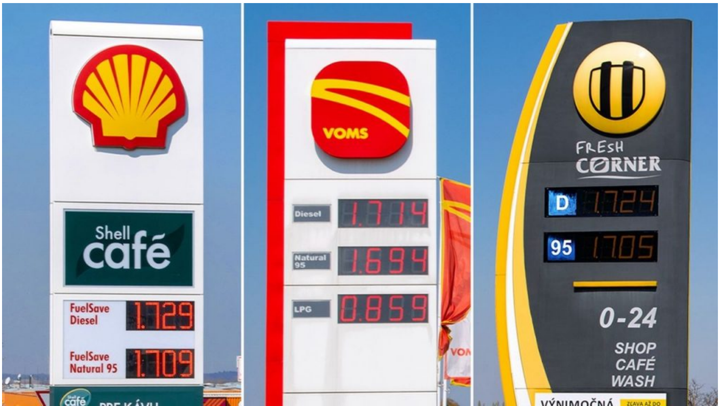
Diesel je podle posledních informací na Slovensku už dražší než benzín

Zboží, které se zaváží 1x za 3 měsíce v roce, se vysoká cena paliv moc neprojeví, protože palivo z kamionu se rozpočítá na zboží, na každý kus zboží, jehož zásoba vydrží na čtvrt toku na skladě prodejny. Ale co třeba mléčné výrobky? Co třeba pečivo? Všechno, co se do obchodů zaváží každý den, se bude muset rozpočítat každý den do malého objemu zboží, které se za ten den prodá.